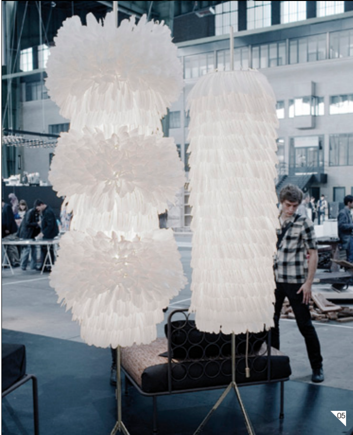
03/ PUMA Colección Black Label, Línea Alexander McQueen, Modelo Joust. A la venta en < www.sivasdescalzo.es > < www.puma.com > 04/ SANDRO Total Look Colección Otoño Invierno 2012-13 < www.sandro-paris.com > 05/ HEINKE BUCHFELDER Lámpara Pluma cubic. < www.pluma-cubic.com >