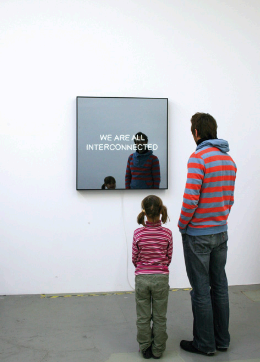
Jeppe Hein. We are all interconnected, 2012. Cortesía Johann König, Berlín y 303 Gallery, Nueva York.