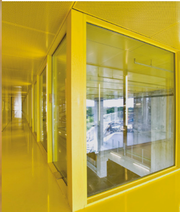
Vista interior del proyecto Mountain Dwellings.

URBANISMO SOCIAL: “En Superkilen tomamos la inmigración como un hecho positivo en la sociedad, fomentamos la diversidad cultural y jugamos con ello, creando una nueva capa de urbanismo social proactivo. Crear ciudad va más allá de crear detalles constructivos, se trata de crear interacción social, conectando de una forma flexible y adaptable en el tiempo las diferentes culturas, lenguajes y formas de entender el espacio público”.