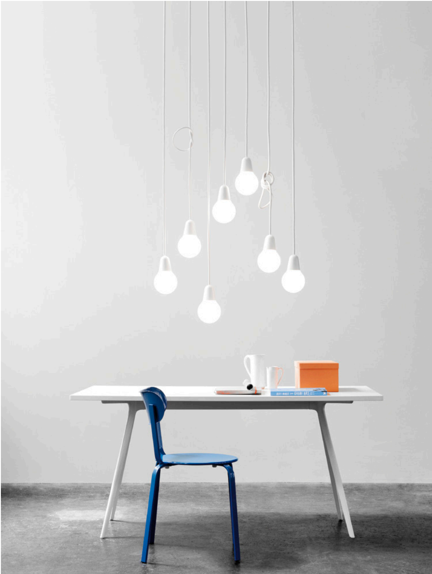
Lámpara Bulb Fiction, diseñada para Lightyears en 2012.