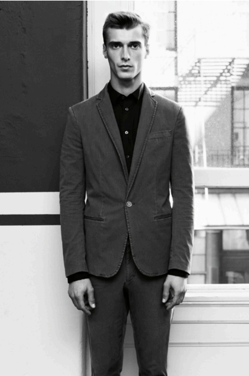
FILIPPA K Primavera Verano 2013 <www.filippa-k.com>