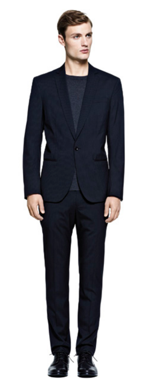
FILIPPA K Primavera Verano 2013 <www.filippa-k.com>