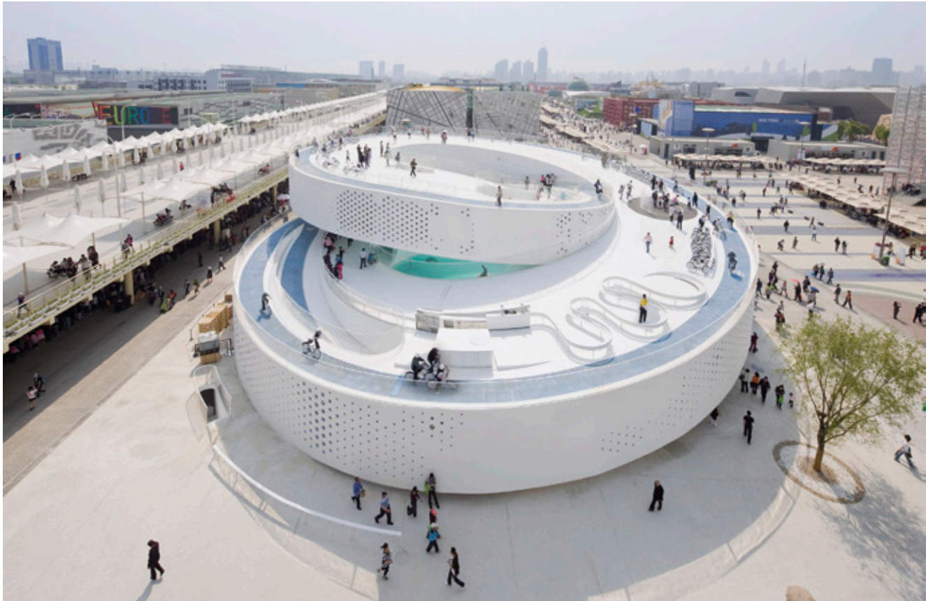
Pabellón de Dinamarca para la Expo de Shanghai en 2010.