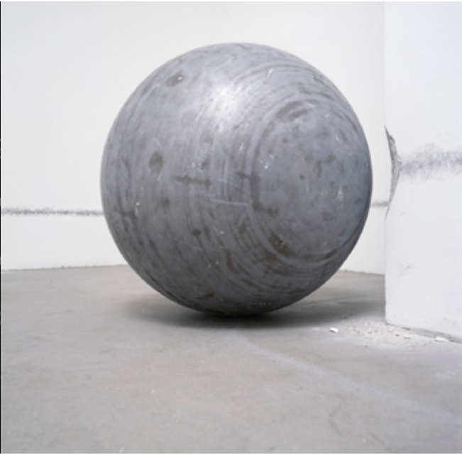
Jeppe Hein. 360° Presence.