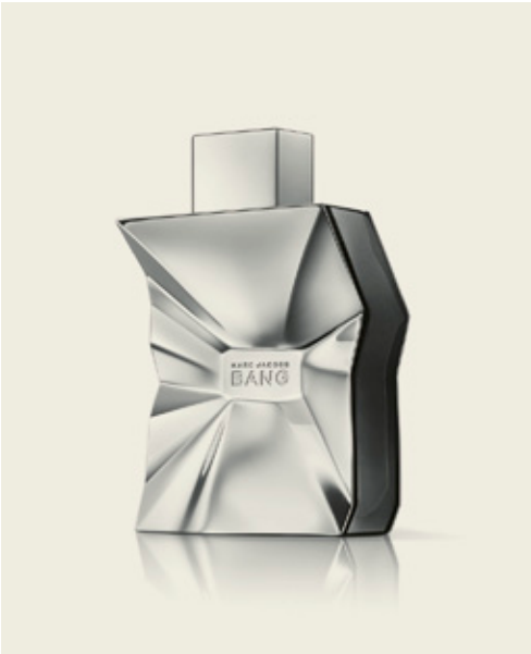
MARC JACOBS Fragancia Bang <www.marcjacobs.com>