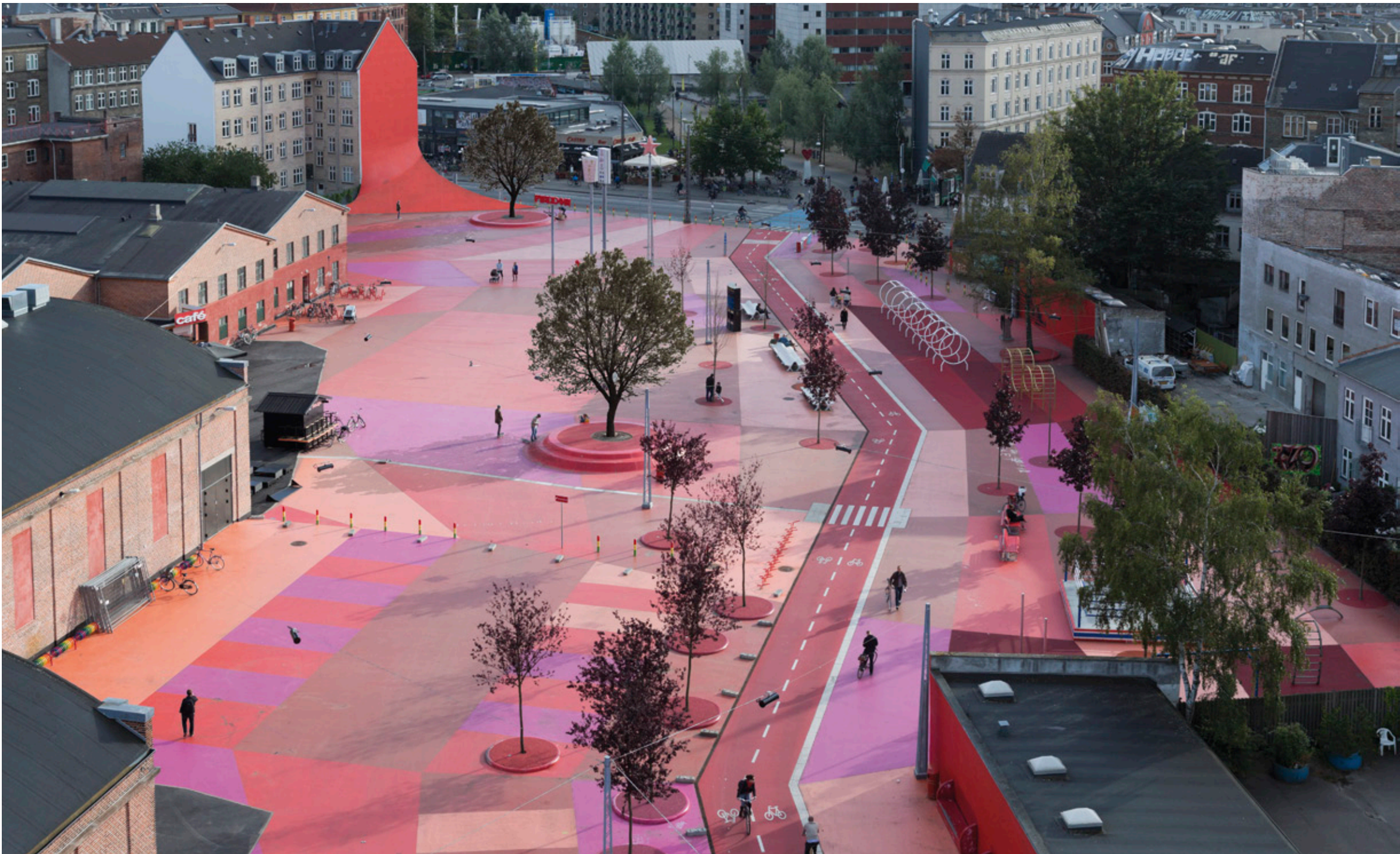
Imagen principal: Superkilen. Una colorista propuesta urbana para la integración social. Detalles parte superior: Distintos detalles de mobiliario urbano para el proyecto Superkilen.