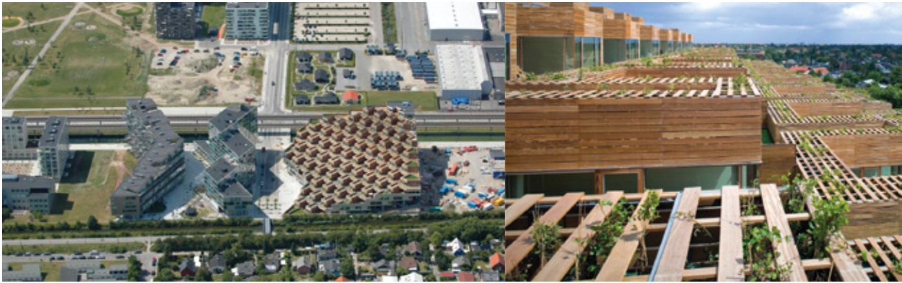
Los proyectos VM en el distrito de Ørestad en Copenhague.