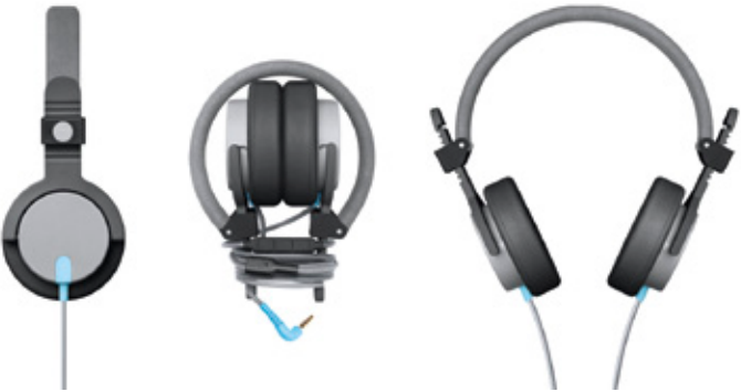
Auriculares Capital, diseñados para Aiaiai en 2012.