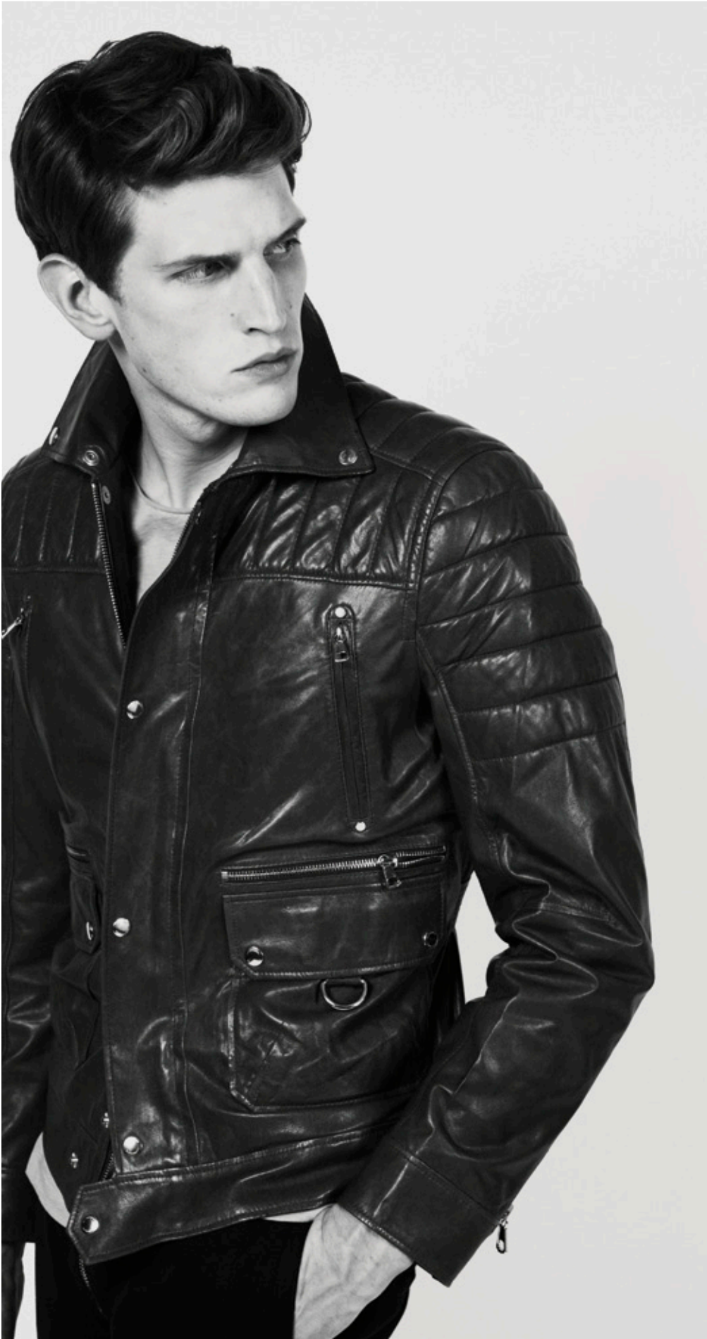
J.LINDBERG Primavera Verano 2013 <jlindeberg.com>