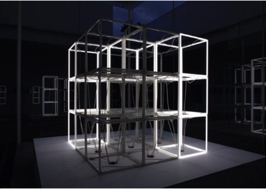
Jeppe Hein. Changing Neon Sculpture, 2006.