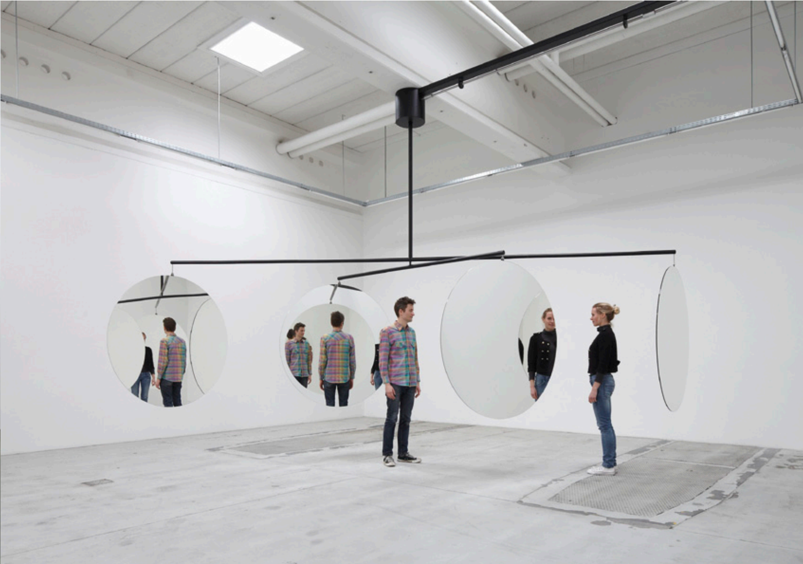
Jeppe Hein. Mobile Mobile, 2010.