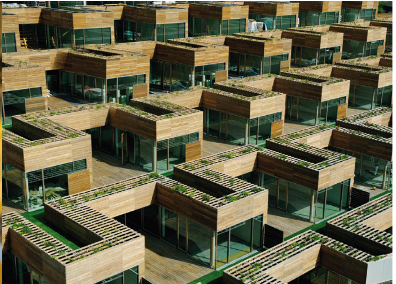
La montaña artificial de viviendas diseñada por BIG.