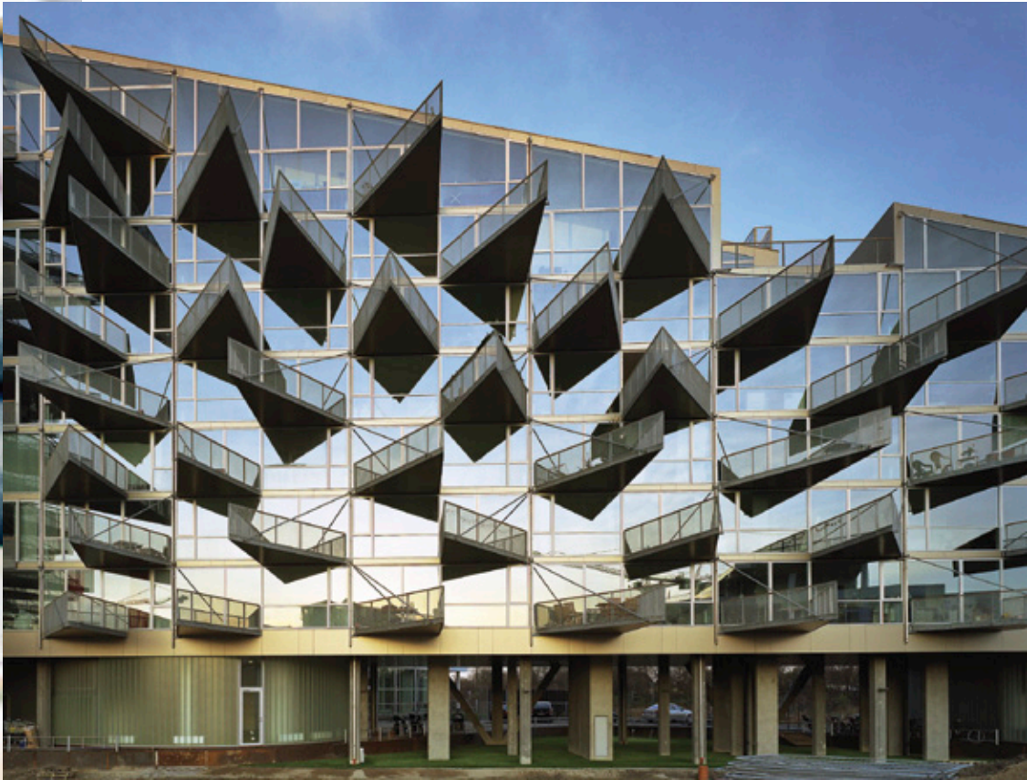
Vista principal de la icónica fachada de las V Houses.

TEXTO: GONZALO HERRERO DELICADO + MARÍA JOSÉ MARCOS