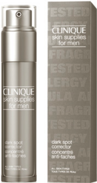
CLINIQUE for Men <www.clinique.es>