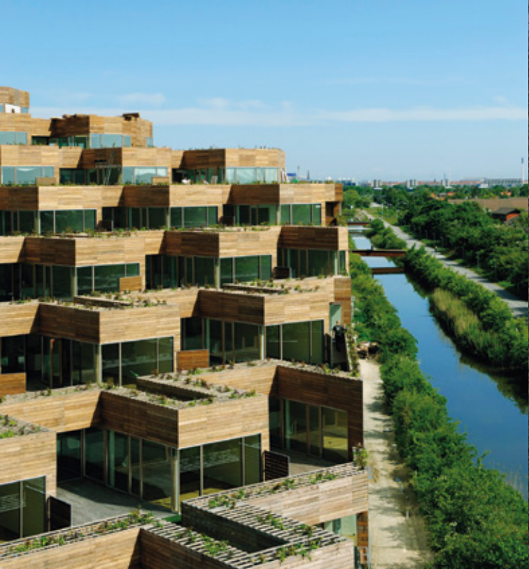
Estructura escalonada para la fachada de Mountain Dwellings.