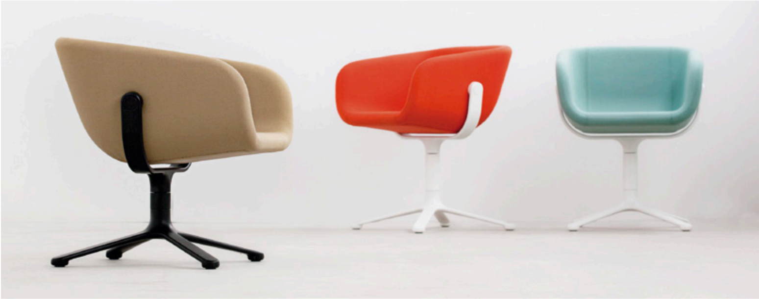
Silla Scoop, diseñada para Globe Zero 4 en 2013.