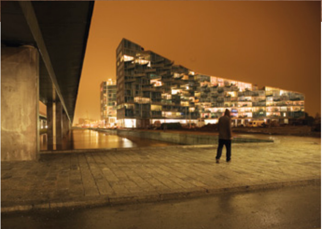
Vista de las V Houses en el distrito de Ørestad en Copenhague.

ESTRENO CATALAN: “Fue también en Barcelona donde monté mi primer estudio de arquitectura. Participé junto con unos compañeros en un concurso en el que fuimos seleccionados y pasamos a la segunda fase. De repente nos vimos en 1993 con 18.000€ y con muchas ganas de hacer cosas. Decidimos entonces abrir nuestro primer estudio en el Carrer Carabassa, junto con otros amigos que antes habían trabajado para Enric Miralles, y que actualmente forman el conocido estudio BOPBAA. Durante seis meses tuvimos la oficina trabajando día y noche en ese proyecto, por desgracia luego no pasamos la segunda fase y decidimos continuar con nuestras carreras por separado”.