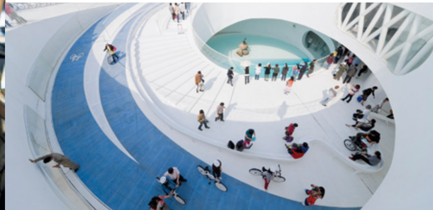
Detalle del interior del Pabellón de Dinamarca con La Sireniita.

V HOUSES: “Cuando inauguramos los edificios de viviendas VM decidí vivir allí, en un ático en las ‘V Houses’. Nunca me imaginé vivir en ese proyecto mientras lo estábamos diseñando, aunque más tarde por diversas circunstancias decidí mudarme allí y fue una experiencia bastante interesante. Vivir dentro de tu creación y darte cuenta de que todas las cosas que has diseñado y pensado de repente funcionan. El único inconveniente que tenía era la localización, el VM estaba un poco apartado del centro de la ciudad y tardaba casi 45 minutos todos los días en llegar a mi estudio en bicicleta. Al cabo de los años decidí trasladarme a un lugar más cerca del centro y más próximo a mi estudio. Ahora estoy viviendo entre Nueva York y Copenhague”.