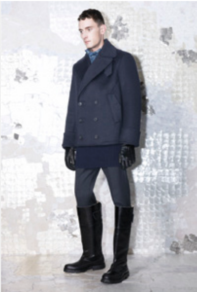
ACNE Otoño 2013 <www.acnestudios.com>