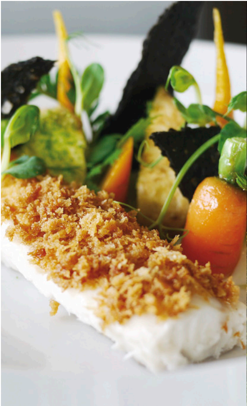
The Fish Bar (Fiskebar)