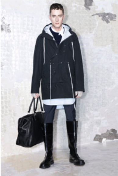
ACNE Otoño 2013 <www.acnestudios.com>