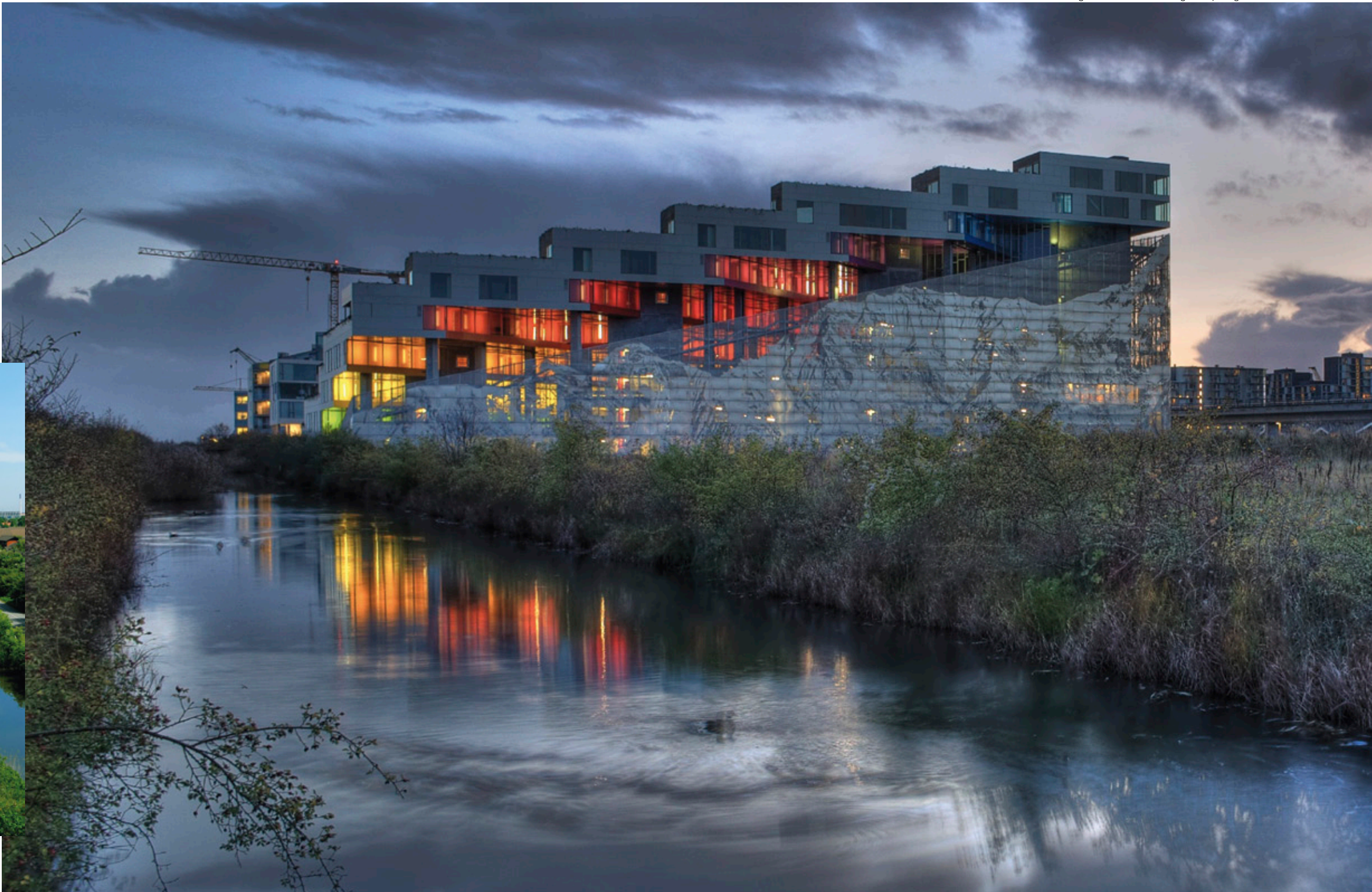
Vista general del Mountain Dwellings en Copenhague.

DIVERSION: “Obviamente me encanta la arquitectura, pero aparte de esto me gusta la ficción, las historias. Me gustan el cine, los libros, las series de televisión y últimamente estoy enganchado a la serie ‘Juego de tronos’, creo que George R. R. Martin es un auténtico genio”.