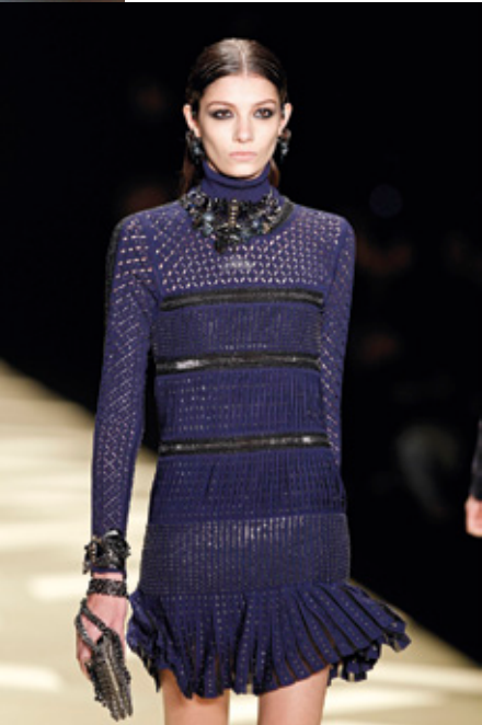
ROBERTO CAVALLI Otoño Invierno 2013-14. Modelo: Muriel Beal. Foto: Estrop / Francesc Tent <www.robertocavalli.com>