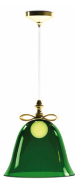
Bell Lamp. Diseño de Marcel Wanders