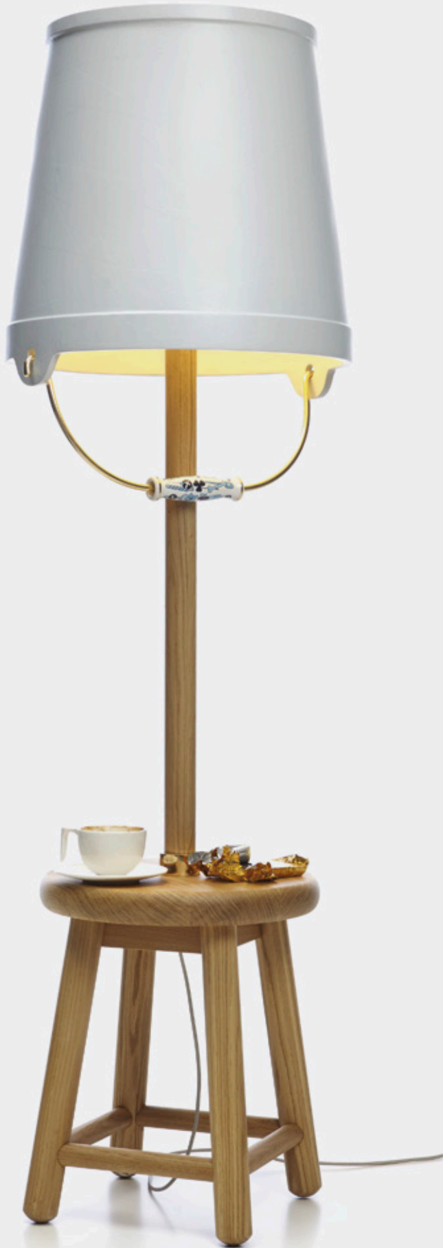
Bucket Lamp. Diseño de Studio Job