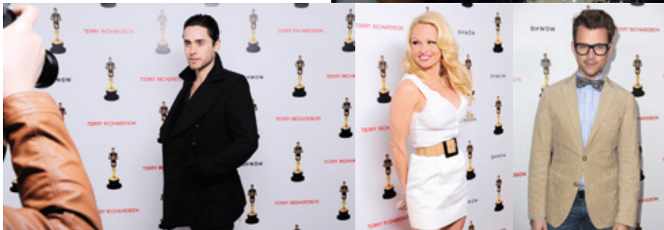
Personajes (derecha a izquierda y arriba abajo): Terry Richardson junto a Johnny Knoxville, Jeremy Scott y Sky Ferreira, Terry Richardson junto a Paris y Nicky Hilton, Jared Leto, Pamela Anderson y Brad Pitt.