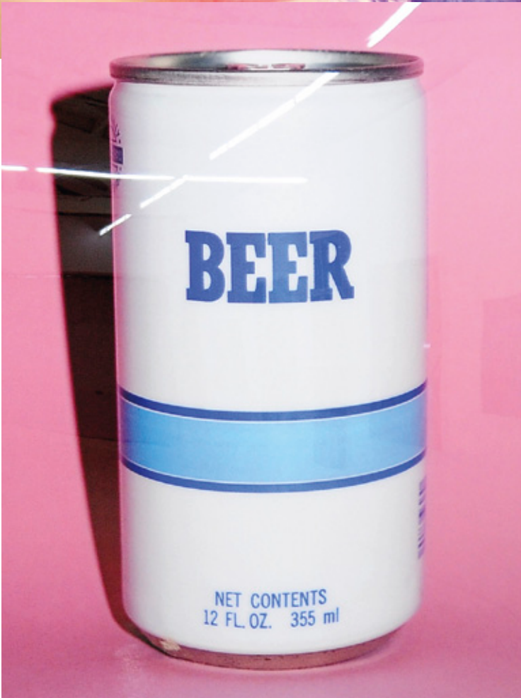
Fotografía de Terry Richardson para la exposición TerryWood. Detalle de la exposición.

se mudó a Londres para empezar a colaborar con revistas como ID o The FACE, hasta que realizó imágenes para una campaña de Katherine Hammett y se introdujo en el mundo de la moda. Hacedor de imágenes de vinculación sexual, deteniéndose en el momento exacto en el que la acción está por acontecer. Su estilo resulta nudista sin llegar al porno, aunque las imágenes explícitas de su libro “Kibosh” señalen lo contrario, y es tan reconocible como la melena setentera de las modelos que protagonizan sus imágenes. La desnudez aquí es algo más que un acto liberador: “Pienso que desnudarse es divertido. Cuando estás sobrio, dejas de beber o de drogarte; necesitas otros estímulos. Andar por ahí desnudo o practicar sexo ante un montón de gente es un ejemplo. Mi lema es no pedir a nadie que haga algo que yo mismo no haría”. Pero no todo es una fiesta a puertas cerradas. El ojo veloz llega a esos exteriores donde la diversión acontece, “Terrywood” la exposición que el fotógrafo realizó en Ohwow de Los Ángeles es una prueba de ello. Bajo tal filtro Hollywood reaparece a través de los deseos de celebridad pero desde la perspectiva de velocidad, consumo y crudeza. La imaginería trágica y bella de Terry Richardson recoge todo tipo de sueños rotos.