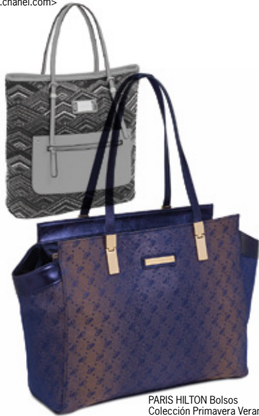
PARIS HILTON Bolsos Colección Primavera Verano 2014 <www.parishilton.com>