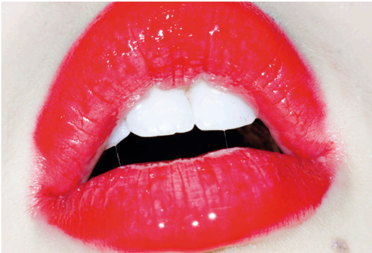
Fotografía de Terry Richardson para la exposición TerryWood. Título: Red lips