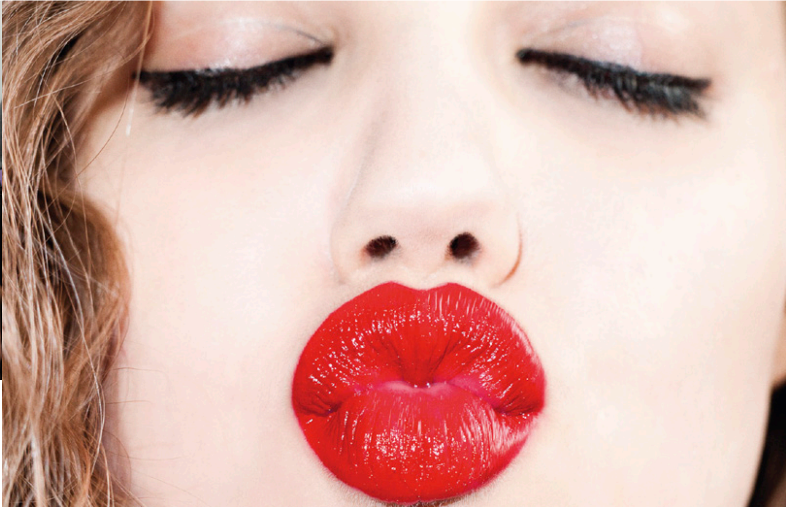
Fotografía de Terry Richardson para la exposición TerryWood. Título: Kiss Kiss