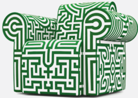
Labyrinth Chair. Diseño de Studio Job