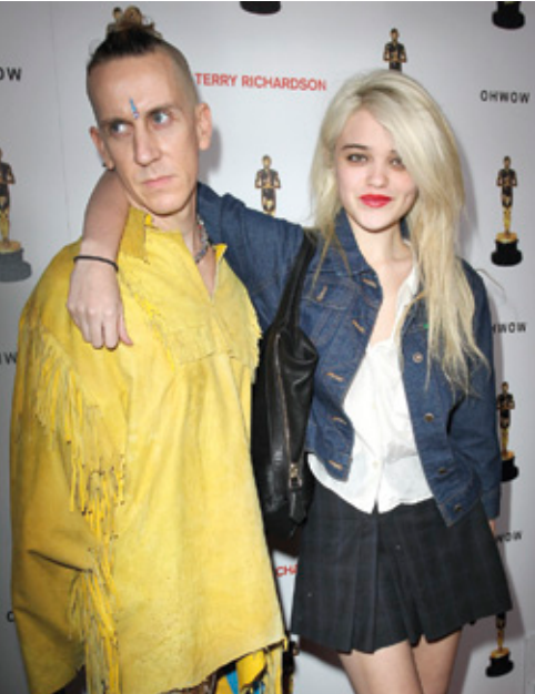
Presentación de “Terrywood”, exposición de Terry Richardson