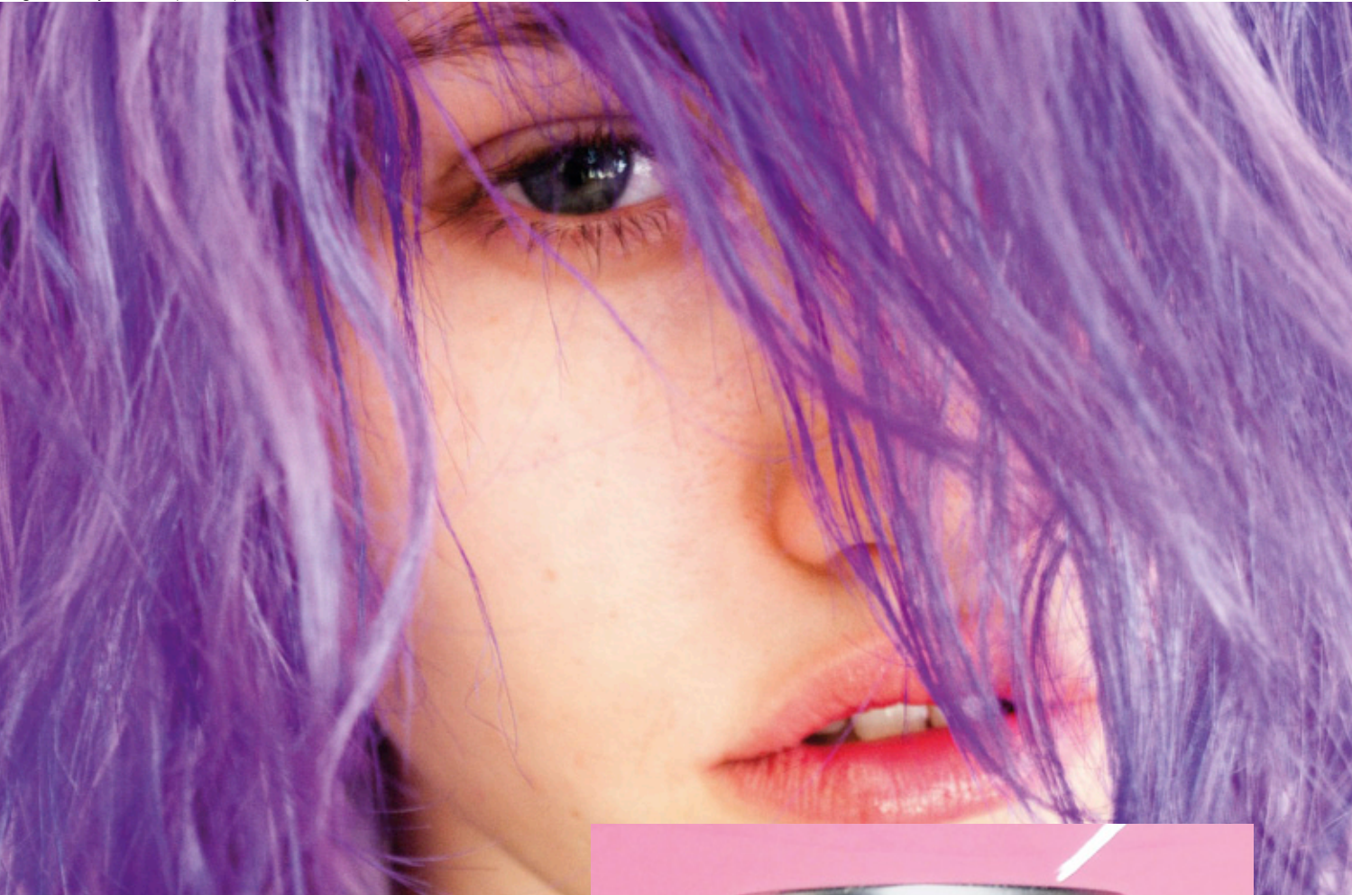
Fotografía de Terry Richardson para la exposición TerryWood. Título: Purple