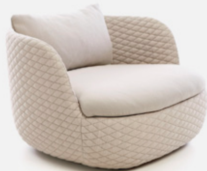
Bart. Diseño de Moooi Works, Bart Shilder