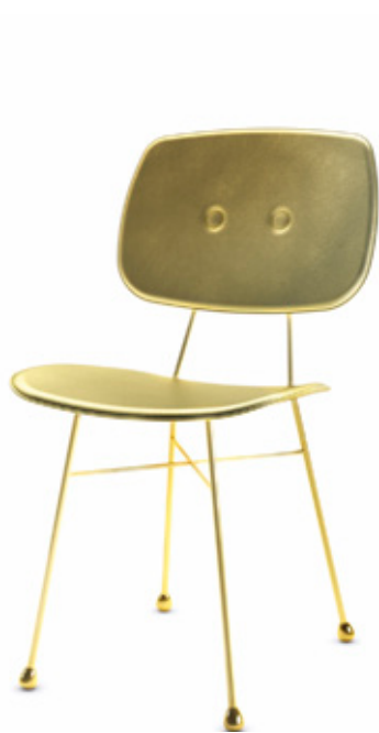
The Golden Chair. Diseño de Nika Zupanc