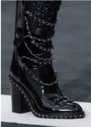
CHANEL Botas Otoño Invierno 2013-14.