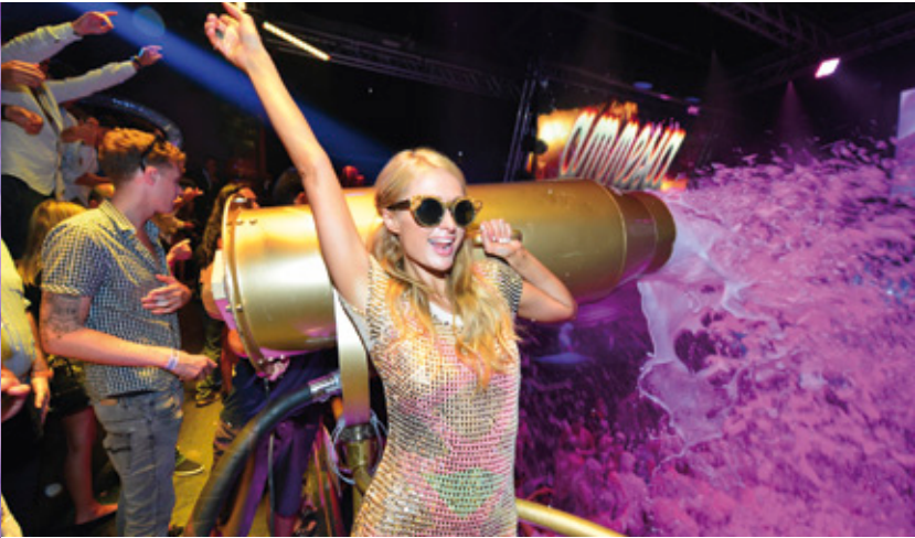
Paris Hilton en Amnesia Ibiza