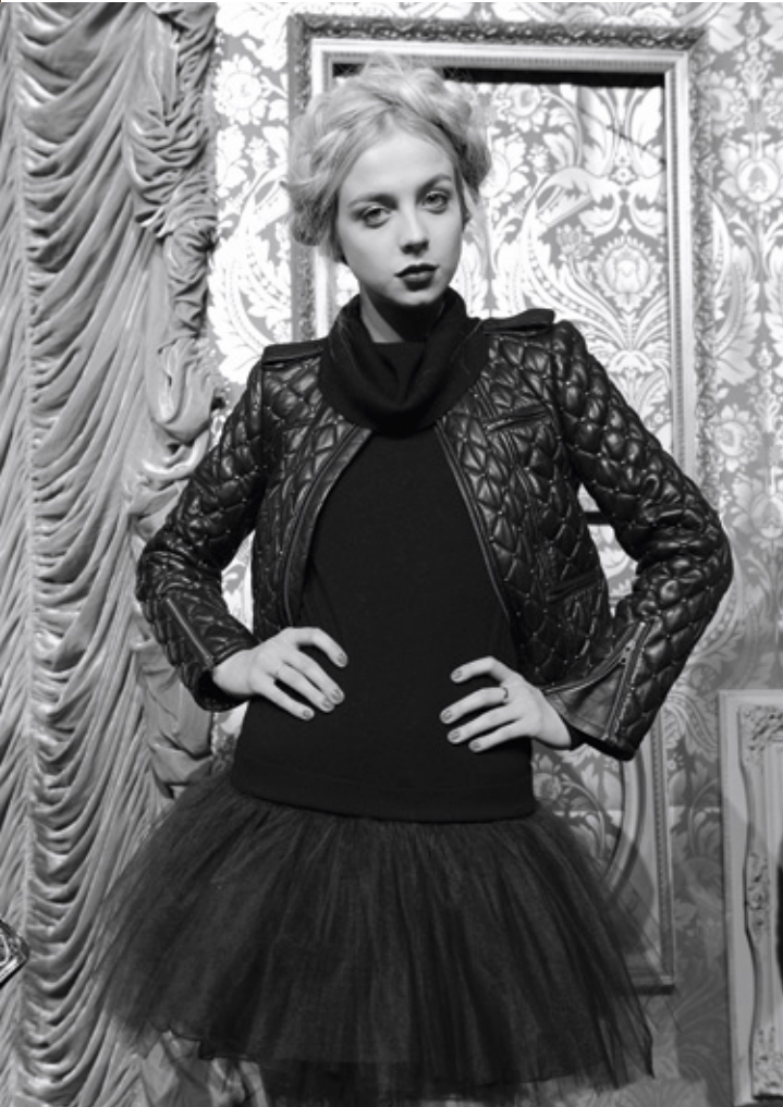
ALICE & OLIVIA Colección Otoño Invierno 2013-14. <www.aliceandolivia.com>