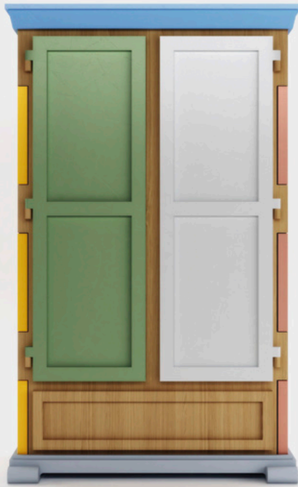
Paper Patchwork. Diseño de Studio Job