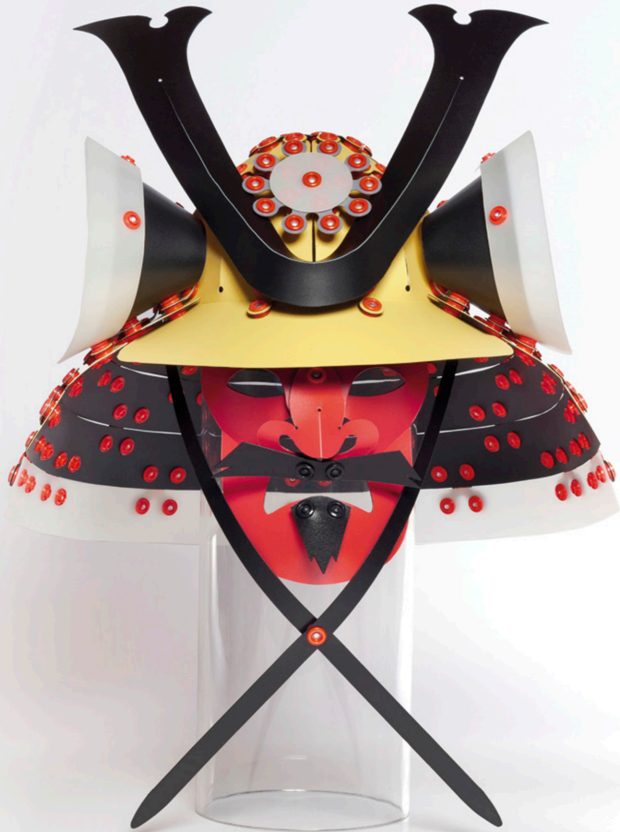
POPLOJIK Casco de Samurai, diseño de Stephen McCabe. <www.poplojik.com>