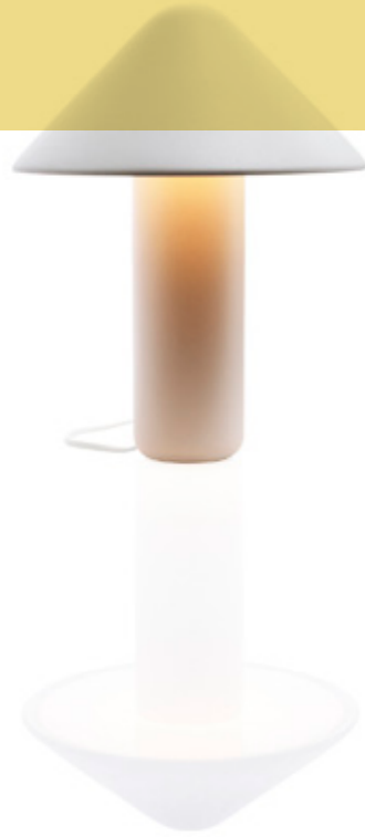
HALL Lámpara diseñada por Hallgeir Homstvedt. 2011 <www.hallgeirhomstvedt.com>