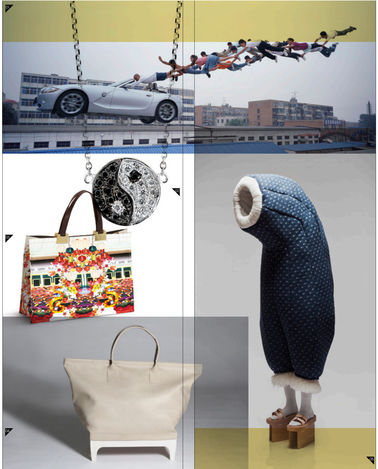
01/ LI WEI Live at the high place 5. 2008. Pekin. 02/ BAO BAO WAN Colgante para Yoox.com <www.yoox.com> 03/ LONGCHAMP BY MARY KATRANTZOU Bolso Tote Le Pliage <www.longchamp.com> 04/ ANNE LORENZ Home Traveller, mobiliario para almacenar. <www.annelorenz.com> 05/ FEMKE AGEMA Colección Otoño Invierno 2012-13. Estilista: Nijnke van Willigenburg <www.femkeagema.nl>