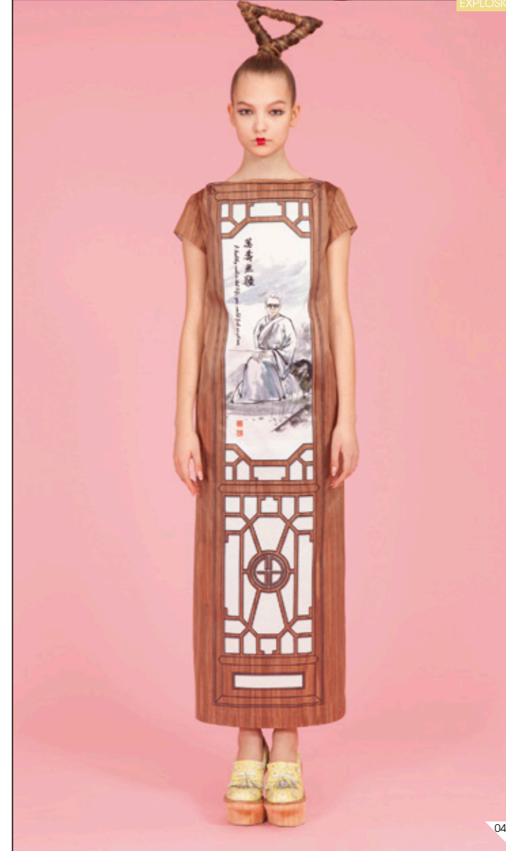
01/ JOHAN CARPNER Lámpara de suspensión Luchisia. 2011. <www.johancarpner.se> 02/ AI WEIWEI Portraits de conte de fées. 2007. © Ai Weiwei 03/ CHRISTOPHE LEMAIRE Plataformas para TheCorner.com <www.thecorner.com> 04/ SIMONE BREWSTER Pulsera para Yoox.com <www.yoox.com> 05/ HAIDER ACKERMANN Cinturón para TheCorner.com <www.thecorner.com> 06/ CAI GUO-QIANG Fuegos artificiales para la ceremonia de apertura de los Juegos Olímpicos de Pekín. 2008