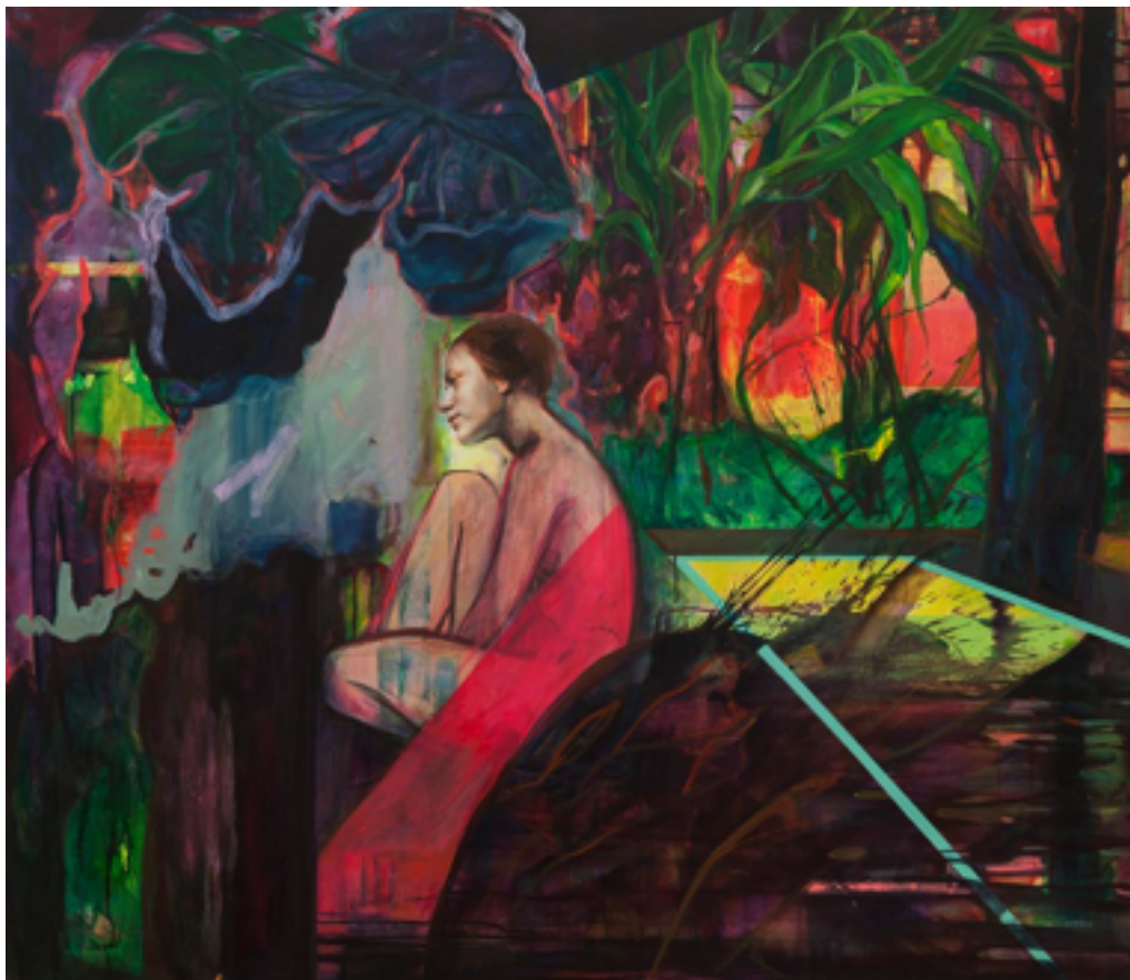
Autor: Sol Halabi. Título: Home. Técnica.: Mixta. Medidas: 160x140 cm