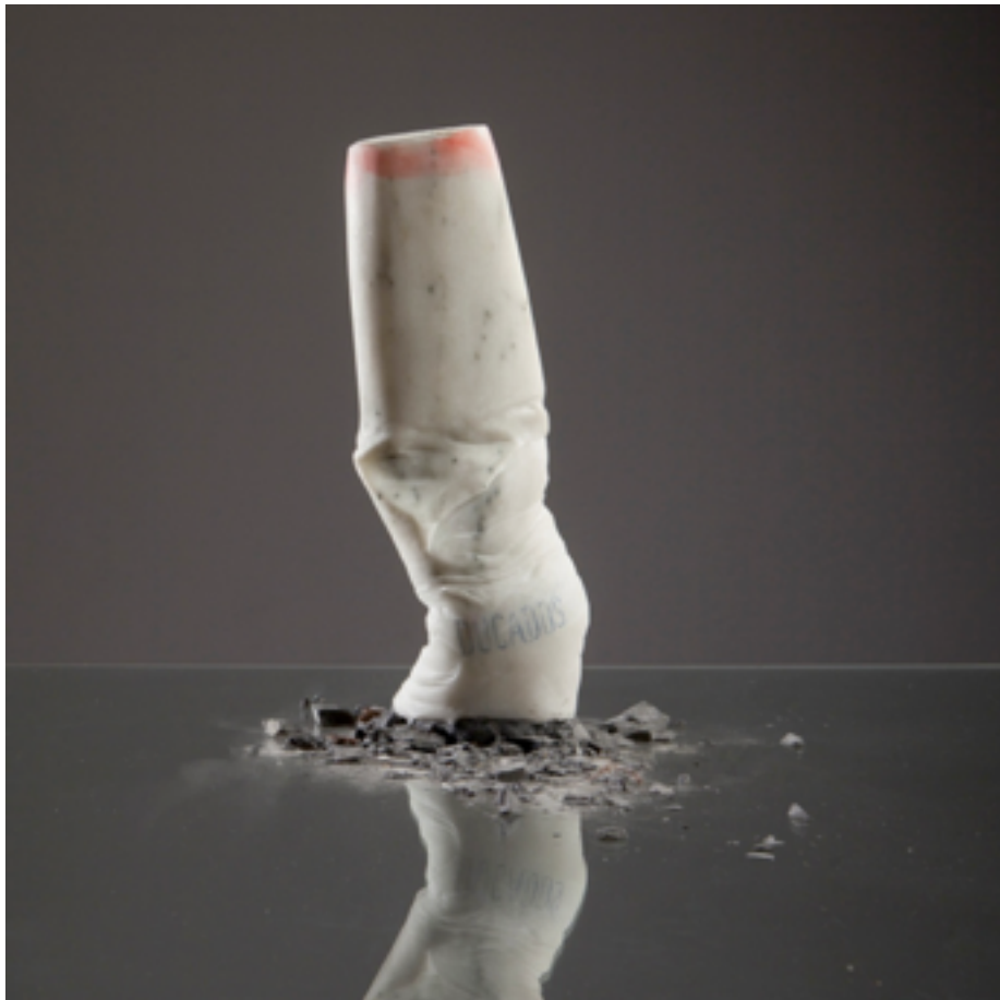
Autor: Mico Rabuñal. Título: Ella. Técnica.: Mixta sobre talla directa. Medidas: 35x12x10 cm