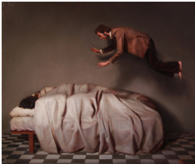
Manuel Páez. Los durmientes. Óleo sobre lienzo. 46 x 55cm