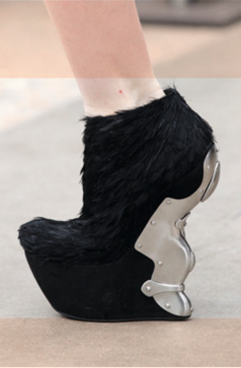
ALEXANDER MCQUEEN by Sarah Burton Zapato Colección Otoño Invierno 2011-12. <www.alexandermcqueen.com> <www.camper.com>