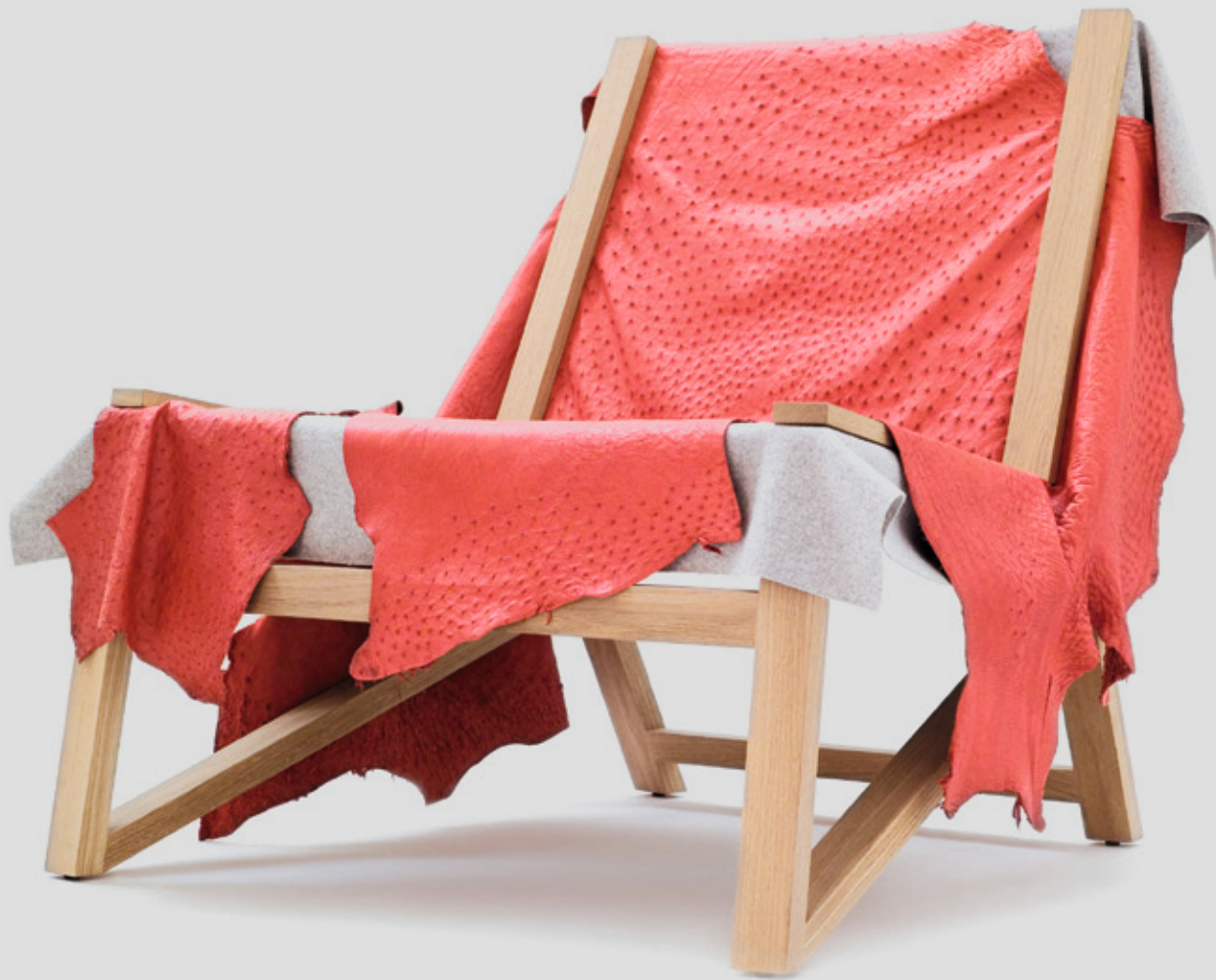
QUINZE & MILAN Silla Second Skin de cuero intercambiable con estructura de madera. < www.quinzeandmilan.tv >