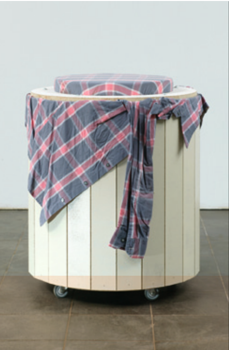
MANFRED PERNICE Konserve 03, 2003.