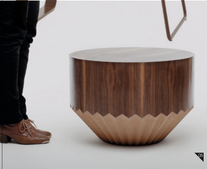
01/ BLANCA MUÑOZ Cueva de Montesinos II, 2006. Cortesía Galería Marlborough, Madrid. 02/ VARASCHIN Aparador de la colección Orsay. Diseño Gordon Guillaumier. < www.varaschin.it > 03/ DIOR Homme by Kris Van Assche Sandalia Botín Colección Primavera Verano 2011. < www.dior.com > 04/ MARNI Guantes Colección Otoño Invierno 2011-12. Foto: Estrop / Francesc Tent. < www.marni.com > 05/ VIA SILLA DLR Diseño de Antoine Frisch. < www.via.fr >