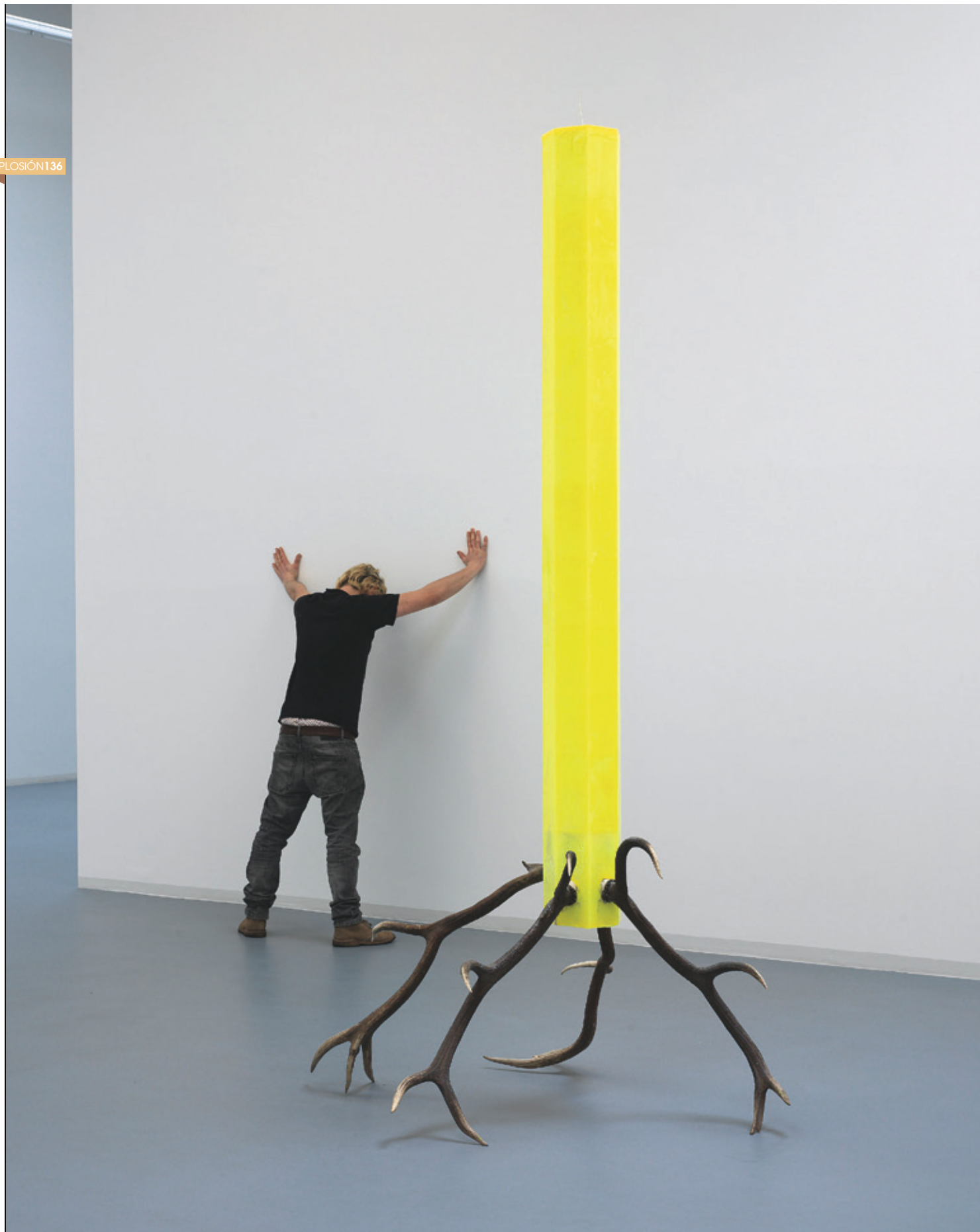
SEB KOBERSTÄDT Bass, 2008