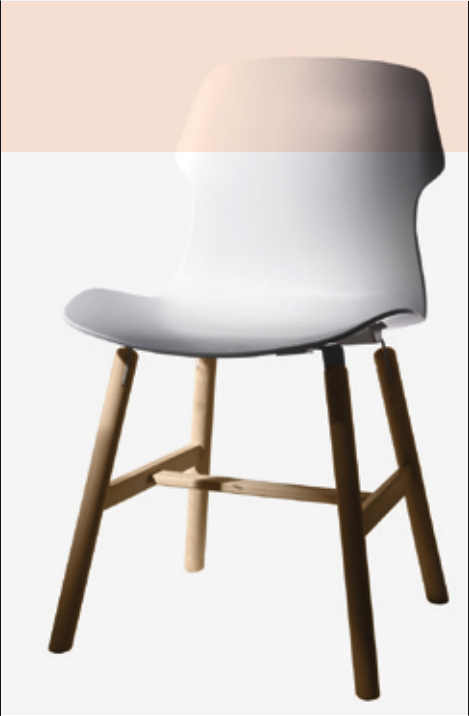
CASAMANIA Silla Stereo Wood de plástico y madera. Diseño de Luca Nichetto. <www.casamania.it>