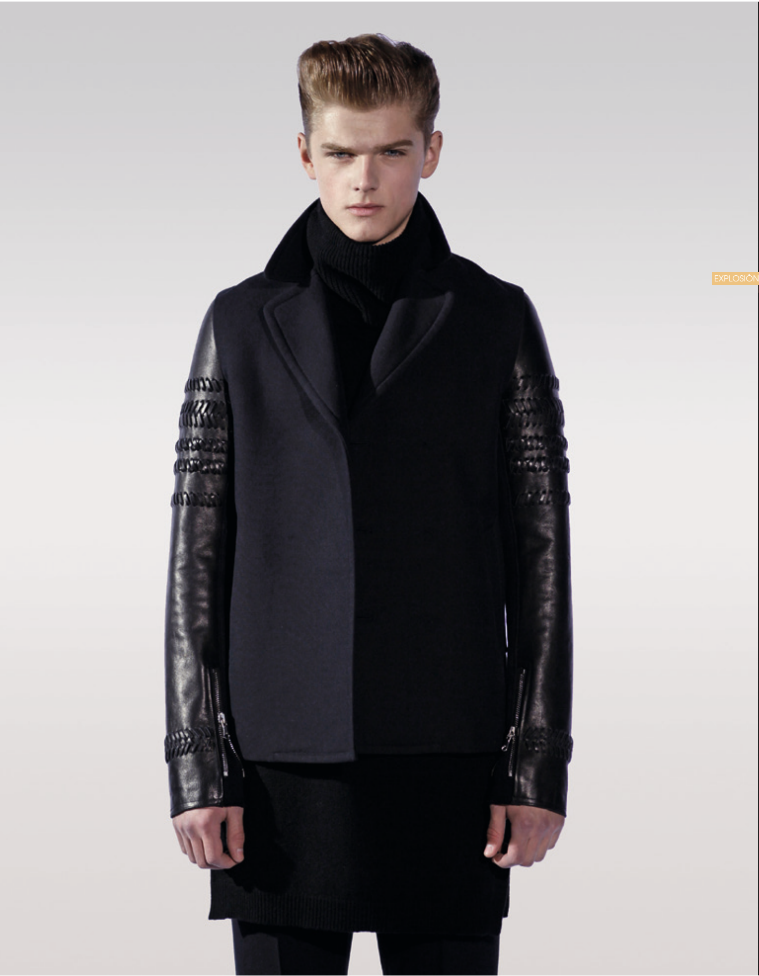
3.1 PHILLIP LIM Colección Hombre Otoño Invierno 2011-12. Foto: Estrop / Francesc Tent <www.31philliplim.com>

EL SEGUNDO SINGLE DEL PRIMER ÁLBUM DE MADONNA, “LIKE A VIRGIN”, FUE, “MATERIAL GIRL”, PUBLICADO EN 1985. PARECE QUE, DEBIDO A ESA CANCIÓN, SE GANÓ FAMA DE MUJER CALCULADORA, INTERESADA SOLO EN EL DINERO, Y MUCHOS MEDIOS LA LLAMARON DESDE ENTONCES “CHICA MATERIAL”. LA CHICA EN CUESTIÓN HA SABIDO MANTENERSE EN LO MÁS ALTO DE LA INDUSTRIA MUSICAL DESDE HACE YA VARIAS DÉCADAS, Y NADIE COMO ELLA REPRESENTA MEJOR EL CONCEPTO AL QUE LE HEMOS DEDICADO LA EXPLOSIÓN DE ESTE MES, PORQUE MADONNA HA SABIDO SIEMPRE MEZCLAR EN SU INDUMENTARIA TODO TIPO DE PRENDAS, AUNQUE EN PRINCIPIO PUDIERAN PARECER ANTAGÓNICAS. SOBRE LAS MEZCLAS, LA CIENCIA ASEGURA QUE HAY REACCIONES QUÍMICAS DONDE CADA UNO DE SUS COMPONENTES MANTIENE SUS CARACTERÍSTICAS, MIENTRAS QUE EN OTROS CASOS PUEDEN REACCIONAR ENTRE SÍ DANDO LUGAR A COMPUESTOS NUEVOS. EN ESTA EXPLOSIÓN NOS HEMOS DECANTADO PRECISAMENTE POR LA MEZCLA DE MATERIALES MUY DIFERENTES, DONDE CADA UNO MANTIENE SU IDENTIDAD, PERO ADQUIERE A LA VEZ UNA NUEVA AL COMBINARSE CON OTROS. MODA, MOBILIARIO Y ARTE SON LOS PROTAGONISTAS DE ESTAS FANTÁSTICAS MEZCLAS. BE MATERIAL!!