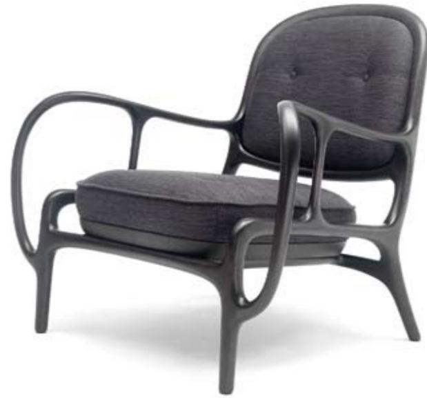
Arriba: CECCOTTI Butaca TwentyTwo, diseño de Jaime Hayon. Está hecha con 22 piezas de madera, de ahí su nombre. <www.ceccotticollezioni.it> Abajo: THONET Taburete alto 404H, diseñado por Stefan Diez. Su asiento está inspirado en una silla de montar. <www.thonet.de>

OLGA: Chaqueta MARTIN GRANT <www.martingrantparis.com> + Collar SUBVERSIVE <www.subversivejewelry.com> + Anillo ALEXIS BITTAR <www.alexisbittar.com>