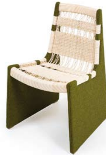
Arriba: DE LA ESPADA Silla Tou diseñada por Leif.designpark, un modelo que combina tapizado de tejido con un respaldo de rattan. <www.delaespada.com> Abajo: GANDIA BLASCO Alfombra Palermo, con un dibujo realizado por la diseñadora gráfica Sandra Figuerola. <www.gandiablasco.com>