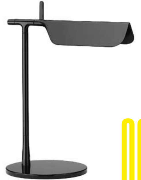
Arriba: FLOS Versión LED de la lámpara Tab diseñada por Barber & Osgerby con la pantalla en forma de un libro medio abierto. <www.flos.com> Abajo: POLIFORM Sofá individual de grandes dimensiones Big Bug, diseño de Paola Navone. <www.poliform.it>