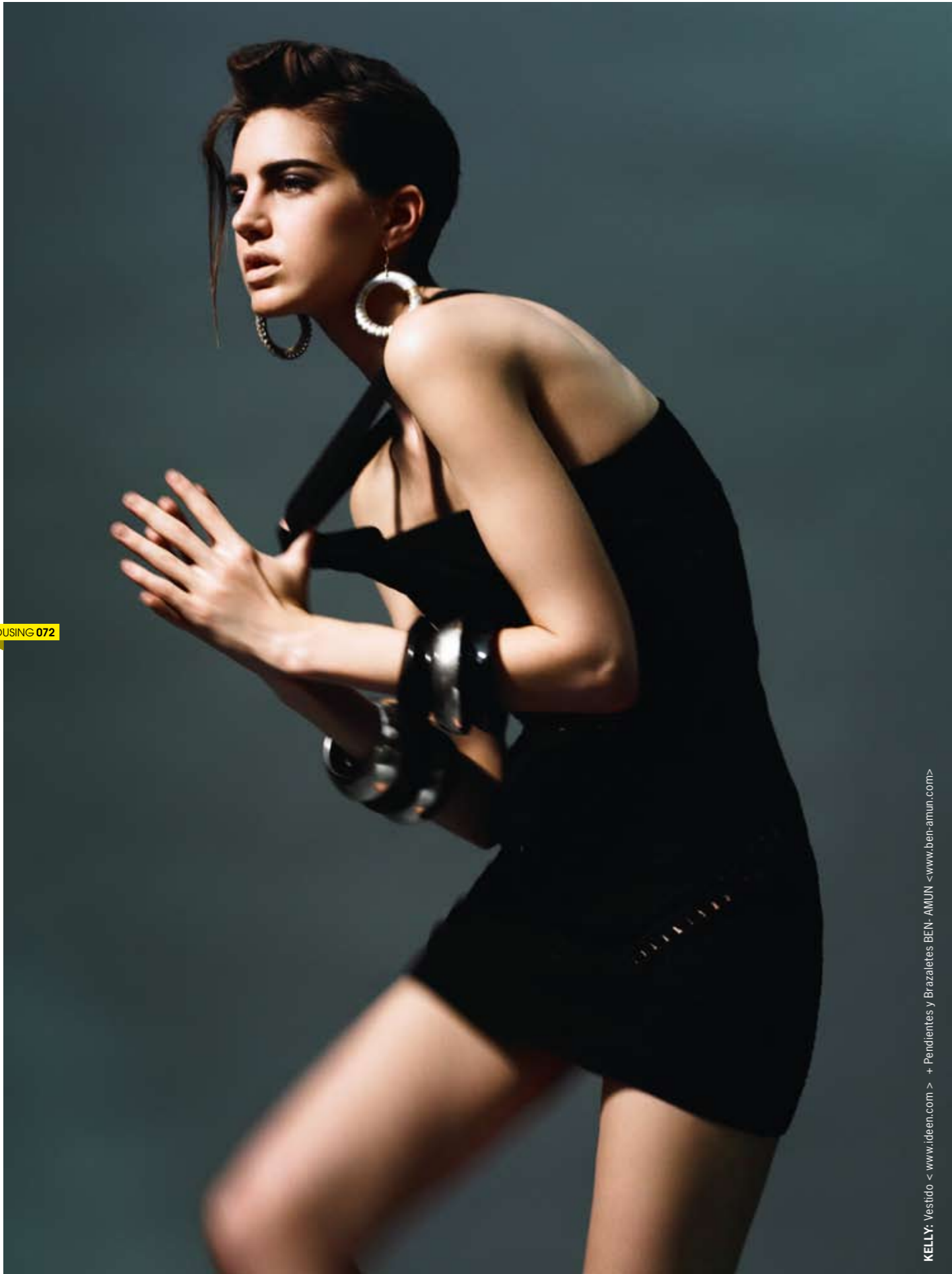
KELLY: Vestido < www.ideen.com > + Pendientes y Brazaletes BEN-AMUN <www.ben-amun.com>