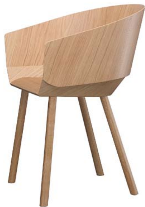
Arriba: E15 Silla CH04 Houdini diseñada por Stefan Diez. Pertenece a una de las colecciones de sillas más interesantes presentadas en 2009. < www.e15.com > Abajo: LUZIFER Lámpara Air diseñada por Ray Power con el material Pollywood ideado por la empresa valenciana. < www.lzf-lamps.com >