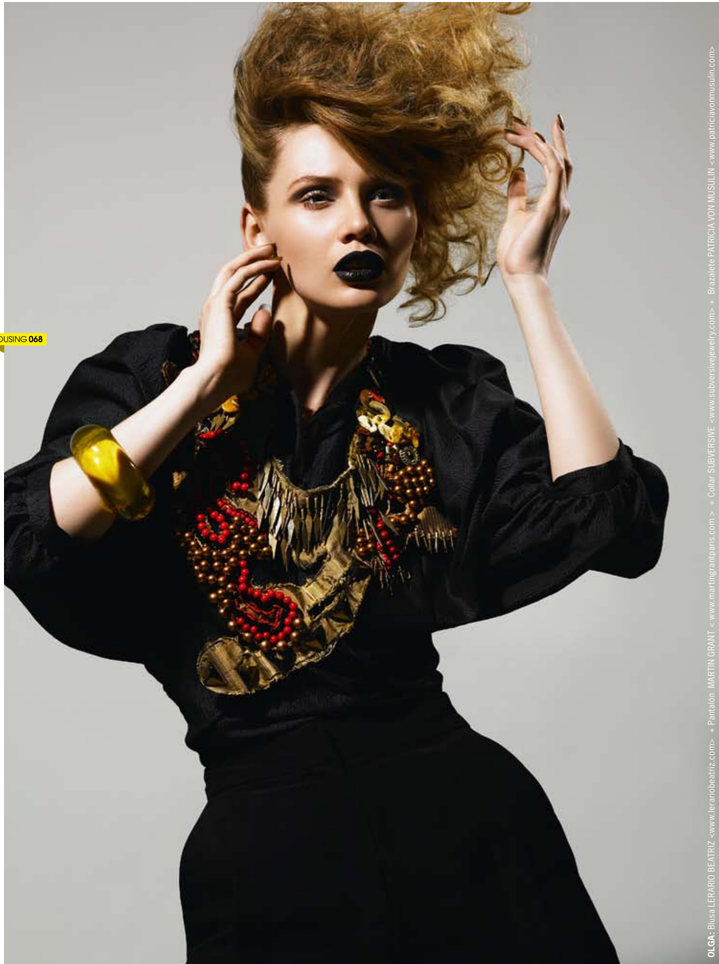
OLGA: Blusa LERARIO BEATRIZ <www.lerariobeatriz.com> + Pantalón MARTIN GRANT <www.martingrants.com> + Collar SUBVERSIVE <www.subversivejewelry.com> + Brazalete PATRICIA VON MUSULIN <www.patriciavonmusulin.com>