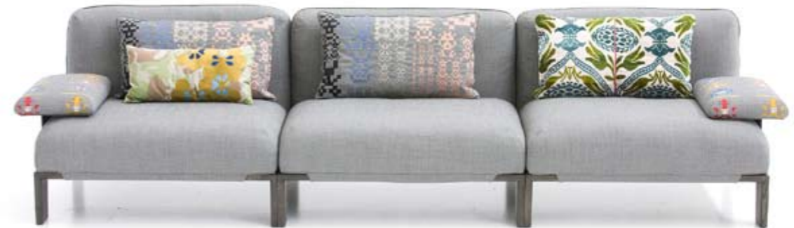
Arriba: MOROSO Sofá Fergana, un diseño de Patricia Urquiola con inspiración en los modelos tradicionales de Uzbekistán. <www.moroso.it>