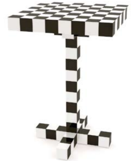
Arriba: MOOOI Mesa Chess, un diseño de mesa auxiliar creado por las suecas Front para jugar al ajedrez <www.mooui.com> Abajo: CAPPELLINI Homage to Mondrian 2, serie de armarios diseñados por Shiro Kuramata en homenaje al pintor abstracto. <www.cappellini.it>