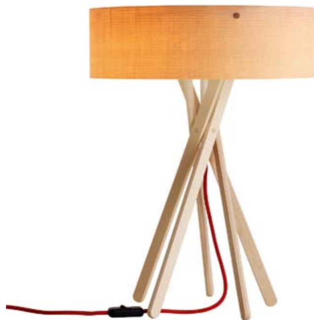
Arriba: BELUX Lámpara de mesa Arba, un diseño de Matteo Thun hecho enteramente en madera de Arce por lo que es fácilmente reciclable. < www.belux.com > Abajo: SANTA & COLE Silla Belloch diseñada por Lagranja. Combina madera y plástico y su punto fuerte es su precio asequible. < www.santacole.com >