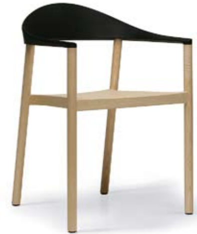
Arriba: PLANK Silla Monza diseñada por Konstantin Grcic, un modelo que combina madera con plástico en su respaldo. <www.plank.it> Abajo: GERVASONI Silla de la colección Sweet, diseño de Paola Navone, de gran respaldo y con el asiento encordado. <www.gervasoni1882.it>