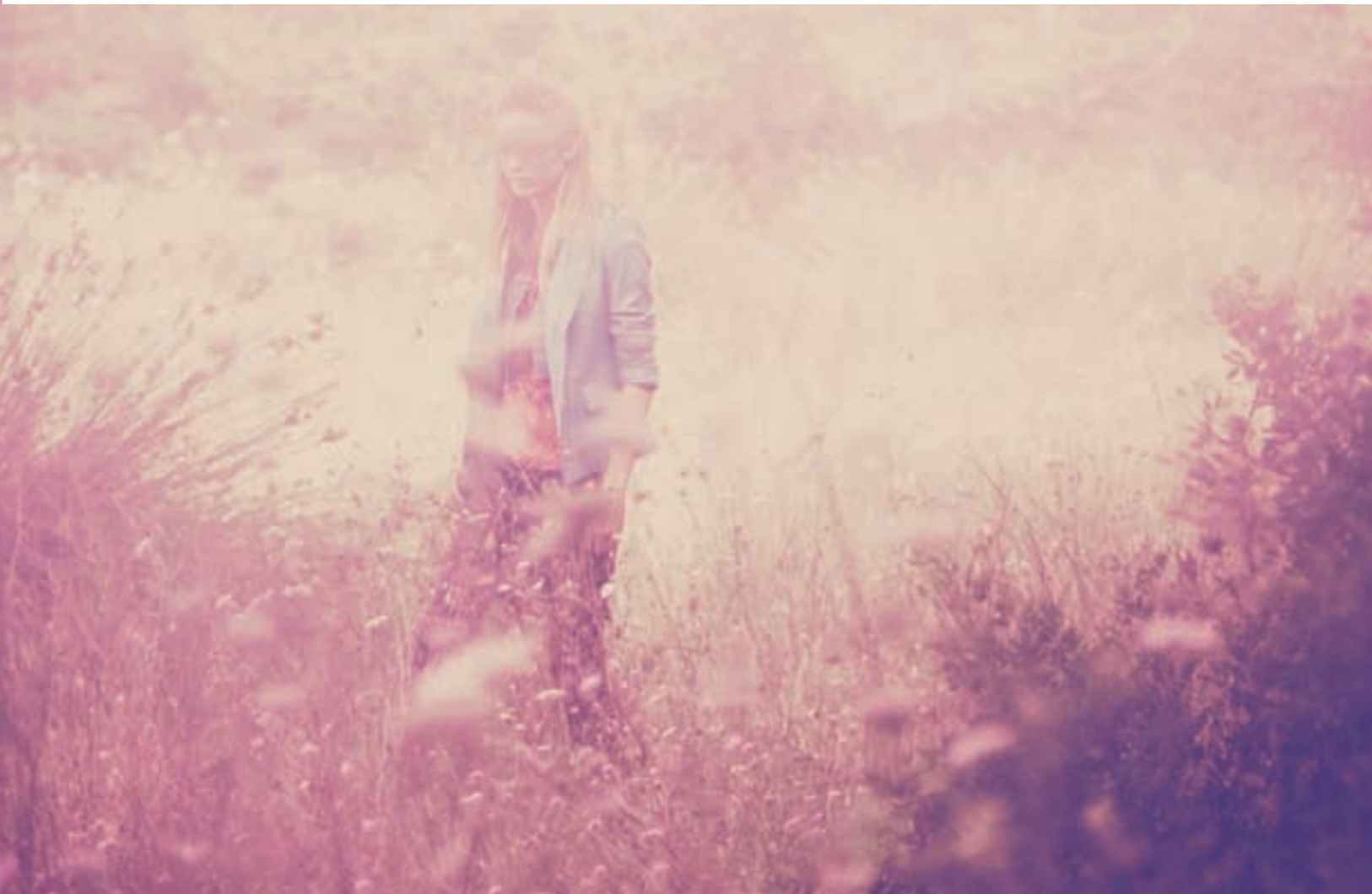
Vestido PAULE KA (+33 1 40 29 03 06) + Chaleco LEVI'S (915 215 028)