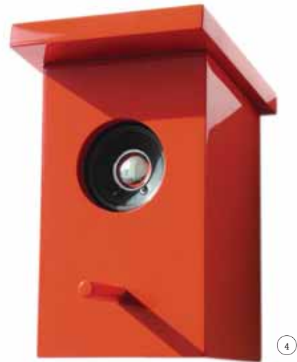
1/ BASSO & BROKE Colección Primavera Verano. 2/ DIOR HOMME Pin. 3/ FLOWER POWER DE REUGE Caja de música, es una edición limitada de 10 piezas. Precio aprox. 8.980 euros. Tel. info: 902 87 71 87. 4/ TWEETY ¿Te imaginas para que sirve? < www.stallinga.nl >