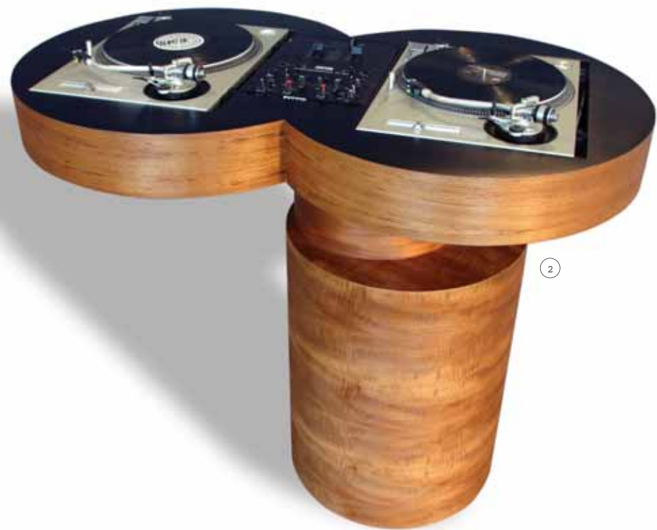
1/ JIM LAMBIE "Acid Perm". Cortesía Sadie Coles Gallery. 2/ 00 DJ TABLE mesa de disc jockey diseñada por Reynold Rodríguez. < www.reynoldrodriguez.com > 3/ SWATCH Colgante Plato Vinilos. PAGINA SIGUIENTE/ JIM LAMBIE Detalle de "Body Talk". Instalación Bienal de Lyon. Cortesía del artista. The Modern Institute, Glasgow; Anton Kern Gallery, New York.