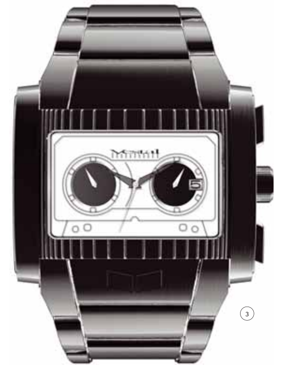
1/ AUDIOLAB un sistema para escuchar música "como si te estuviera lloviendo encima" según dicen sus creadores: los hermanos Bouroullec. El proyecto fue realizado para la galería Kreo de París. Fotos: Marc Damage. < www.bouroullec.com > 2/ MARC BIJL "Reason to Believe". Instalación compuesta por 22 altavoces y 22 reproductores de cedés. Por cortesía del MUSAC. 3/ VESTAL Reloj Casette.