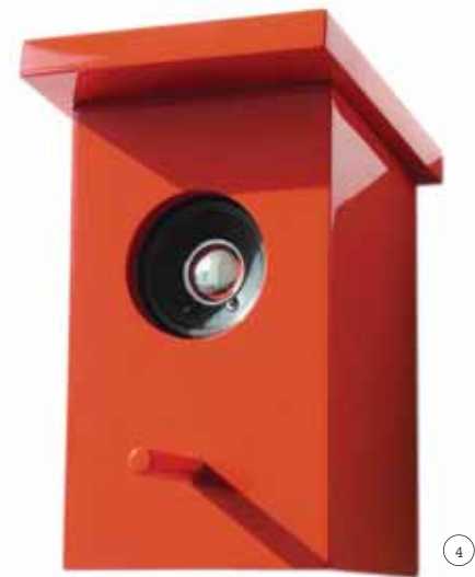
1/ BASSO & BROKE Colección Primavera Verano. 2/ DIOR HOMME Pin. 3/ FLOWER POWER DE REUGE Caja de música, es una edición limitada de 10 piezas. Precio aprox. 8.980 euros. Tel. info: 902 87 71 87. 4/ TWEETY ¿Te imaginas para que sirve? <a href="http://www.stallinga.nl">www.stallinga.nl</a>