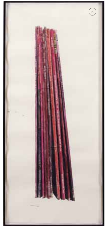
1/ UNDERGROUND Zapas. 2/ CHRISTOPH BÜCHEL "Minus" (2002) Concierto e instalación, Migros Museum, Zürich. 3/ JEFF WALL "The Guitarist" (1987) 4/ MIXTREE un árbol musical que permite mezclar los sonidos y textos que uno quiera diseñado por la francesa Matali Crasset. < www.matalicrasset.com > 5/ GSUS Camiseta Chica. 6/ DAVE MULLER "Mike's Top Ten (PINK)"