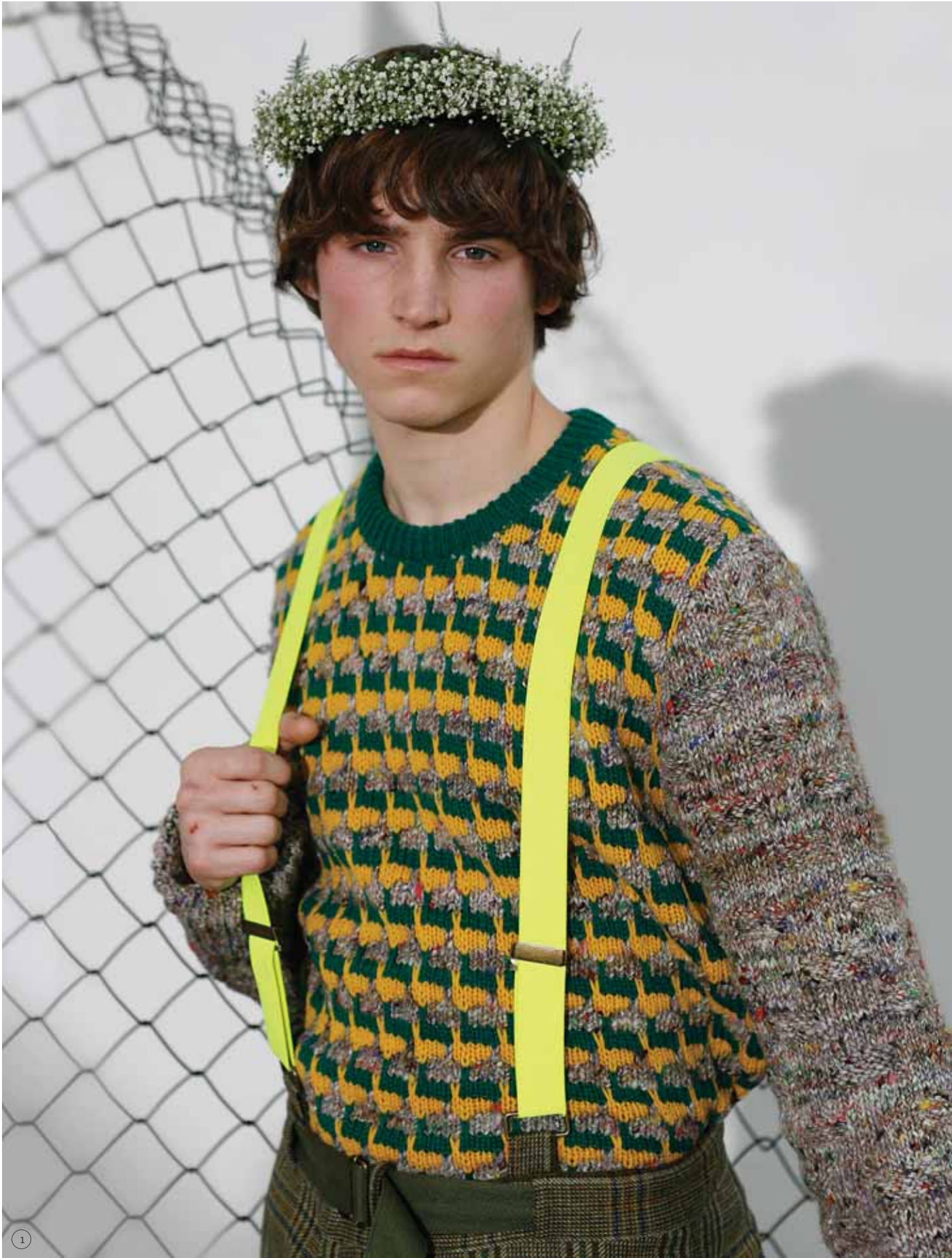
1/ BERNHARD WILLHELM Colección Hombre Otoño Invierno 06/07 (Foto: Estrop / Carles Cubos) 2/ SILLA Y TABURETE PIRKKA. Diseño de Ilmari Tapiovaara (1955). Produce Tapiovaara design <www.ilmaritapiovaara.fi> 3/ SPORTMAX Colección Otoño Invierno 06/07 (Foto: Estrop / Carles Cubos) 4/ SANDRINE PELLETIER. "Wrestler number 6" (2004), 70 x 52 cm. Cortesía Galería Frank Elbaz, París. 5/ JORIS LAARMAN. "Crossbreed" (2006)