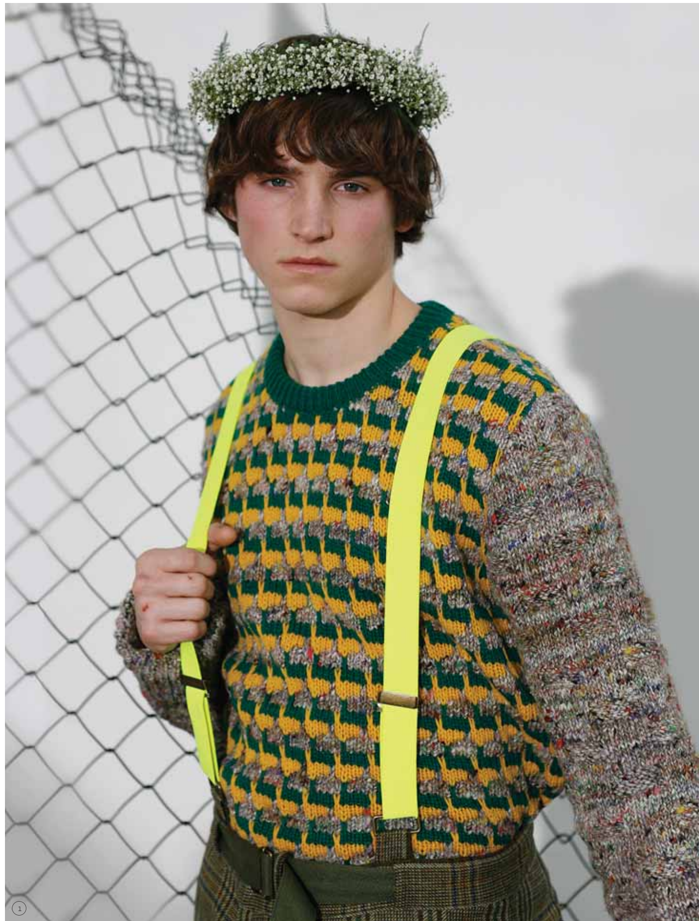
1/ BERNHARD WILLHELM Colección Hombre Otoño Invierno 06/07 (Foto: Estrop / Carles Cubos) 2/ SILLA Y TABURETE PIRKKA. Diseño de Ilmari Tapiovaara (1955). Produce Tapiovaara design <www.ilmaritapiovaara.fi> 3/ SPORTMAX Colección Otoño Invierno 06/07 (Foto: Estrop / Carles Cubos) 4/ SANDRINE PELLETIER. "Wrestler number 6" (2004), 70 x 52 cm. Cortesía Galería Frank Elbaz, Paris. 5/ JORIS LAARMAN. "Crossbreed" (2006)