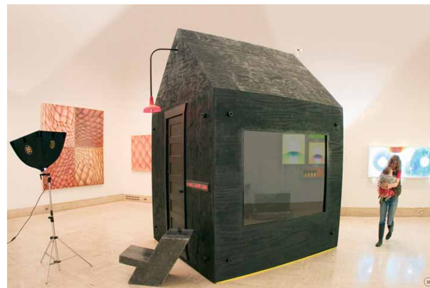
1/ DIESEL Cartera <www.diesel.com> 2/ 55DSL Cinturón <www.55dsl.com> 3/ NIKE Zapa Zoom Blazer <www.nike.com> 4/ BURBERRY Colonia 100 ml <www.burberry.com> 5/ CHANEL Gorro <www.chanel.com> 6/ FRANKIE MORELLO Gorro Oso Colección Otoño Invierno 06/07 (Foto: Estrop / Carles Cubos) 7/ DIESEL Gorra Colección Otoño Invierno <www.diesel.com> 8/ ANN DEMEULEMEESTER Colección Otoño Invierno 06/07 (Foto: Estrop / Carles Cubos) 9/ GF FERRÉ Bolso Colección Otoño Invierno <www.gianfrancoferre.com> 10/ DENIS SIMACHEV Colección Otoño Invierno (Foto: Estrop / Carles Cubos) 11/ WALTER VAN BEIRENDONCK Colección Otoño Invierno 06/07 (Foto: Estrop / Carles Cubos) 12/ SWATCH Detalle. Modelo Folkloral Chic <www.swatch.com> 13/ ALEXANDER MCQUEEN Tocado Mujer Colección Otoño Invierno 06/07 (Foto: Estrop / Carles Cubos) 14/ MARLBORO CLASSICS Bufanda <www.marboroclassics.valentinofashiongroup.com> 15/ MESA BALLS. Diseño de Bertjan Pot, 2006 para Moooi <www.moooi.nl> 16/ CABAÑA DE ESCRITOR de Mark Moskovitz <www.fiftytwothousand.com>