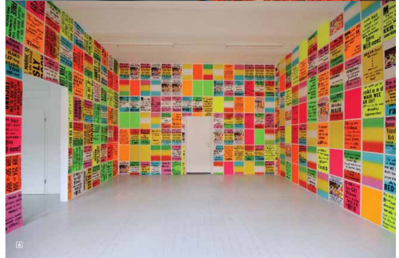
1/MOROSO Sillas bajas diseñadas por Stefan Diez y Christophe de la Fontaine < www.morosoi.it < www.stefan-diez.com 2/GIAODAN CUP Colección Primavera Verano Foto Estrop / Carles Cubo 3/PATRICK TUTTOFUOCO "Twister", 2005. Cortesía de Villa Mavin Contemporary Art Centre 4/GALLIANO Segunda Línea John Galliano Primavera Verano 5/COMME DES GARÇONS Colección Hombre Otoño Invierno 07/08 Foto Estrop / Carles Cubo 6/ALLEN RUPPERSBERG "The Singing Posters, part II&III". Vista de la instalación. 2005. Cortesía de Galerie Karin Guenther. Hamburgo.