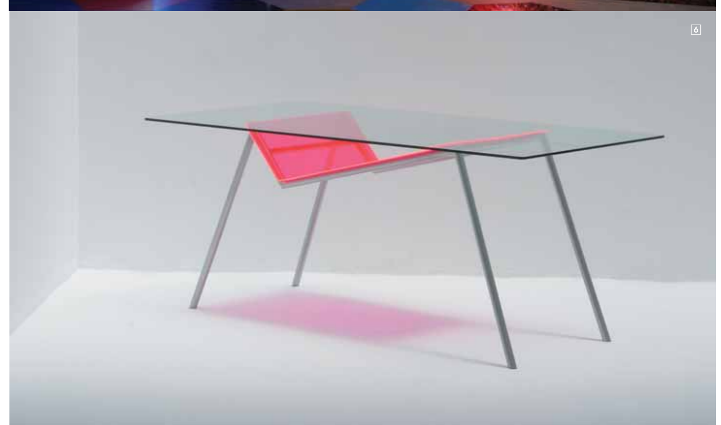
1/CHRISTOPHER KANE Colección Primavera Verano Foto: Estrop / Carles Cubos 2/CUSTO BARCELONA Colección Primavera Verano <www.custo-barcelona.com> Foto: Estrop / Carles Cubos 3/RACHEL HARRISON "Al Gore", 2007. Cortesía de la artista y Greene Naftali Gallery, New York 4/QUODES Una estantería convertida en estantería, diseño de Alfredo Häberli. <www.quodes.com> 5/ASSUME VIVID ASTRO FOCUS Vista de la instalación en Casa Triángulo, Sao Paulo, 2006. Cortesía de John Connolly Presents, Nueva York y Casa Triángulo, Sao Paulo 6/STONE DESIGNS La mesa Replay está realizada con metal lacado, metacrilato y cristal. <www.stone-dsgns.com>