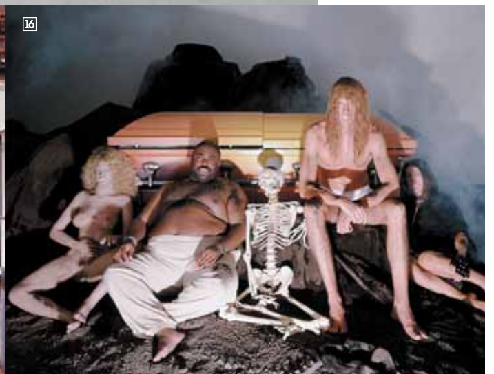
1/55DSL Cazadora chico colección otoño invierno 07/08 <www.55dsl.com> 2/BARRIO SANTO Camiseta Sábana Blanca. Colección otoño invierno 07/08 <www.barriosanto.com> 3/LOUIS VUITTON Gorra chica colección otoño invierno 07/08 <www.louisvuitton.com> 4/NEW ERA Gorra unisex colección otoño invierno 07/08 <www.neweracap.com> 5/ECKO RED Top chica colección otoño invierno 07/08 <www.hecko.com> 6/GIOSEPPO Bota chica colección otoño invierno 07/08 <www.gioseppeos.com> 7/LEE Camiseta unisex línea Lee Gold. Colección otoño invierno 07/08 <www.lee.com> 8/REPLAY Stiletto modelo Amneris Colección otoño invierno 07/08 <www.replay.it> 9/BARRIO SANTO Camiseta Imperdible. Colección otoño invierno 07/08 <www.barriosanto.com> 10/VANS Zapa Classic Slip-On LX2 RW. Colección otoño invierno <www.vans.com> 11/QUIKSILVER Casco modelo Turoa Option Tartú. Colección otoño invierno <www.quiksilver.com> 12/DIOR HOMME Colgante colección otoño invierno 07/08 <www.dior.com> 13/AGGTELEK Sin título. Fotografía sobre aluminio - 2006. Cortesía de los artistas y de la galería Luis Adelantado 14/LOUIS VUITTON Colgante fémur chica. Colección otoño invierno 07/08 <www.louisvuitton.com> 15/ÁNGELES AGRELA Los elegidos, 2003. Fotografía sobre aluminio - Cortesía de la artista 16/OLAF BREUNING Vampires, 2002, Cortesía de Australian Centre For Photography