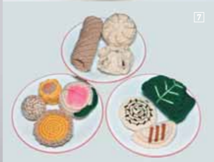
1/ ZEVS Liquidated MC Donald, 2006. Fotografía sobre aluminio Cortesía de la galería Patricia Dormann, Paris 2/ STUC ON YOU HOOKS <www.theermonthupton.com> 3/ JOHN BOCK Alice Cooper, Berlin 2001. video 04'54" Cortesía de Klosterfelde, Berlin; Anton Kern, NY Foto Knut Klafen 4/ ERWIN WURM Fat House, 2003 Cortesía del artista 5/ BIG BIRD Casita para pájaros diseñada por Celine Shenton <www.celineshenton.com> 6/ BREAKFAST TIME Desayuno de ganchillo. Colección 'Crochet Pattern' de NeedleNoodles 4$ <http://needlenoodles.com> 7/ AMIGURUMI DIM SUM Delicias chinas de ganchillo. Colección 'Crochet Pattern' de NeedleNoodles 5$ <http://needlenoodles.com> 8/ INTERNATIONAL PONY Portada del disco 'Mit Dir Sind Wir Vier' (Mule /Kompakt) <www.internationalpony.com> 9/ ADIDAS Zapa Metro Attitude (Stars) + Pullover L-Check. Fotógrafo: KENNETH CAPPELLO <www.adidas.com>