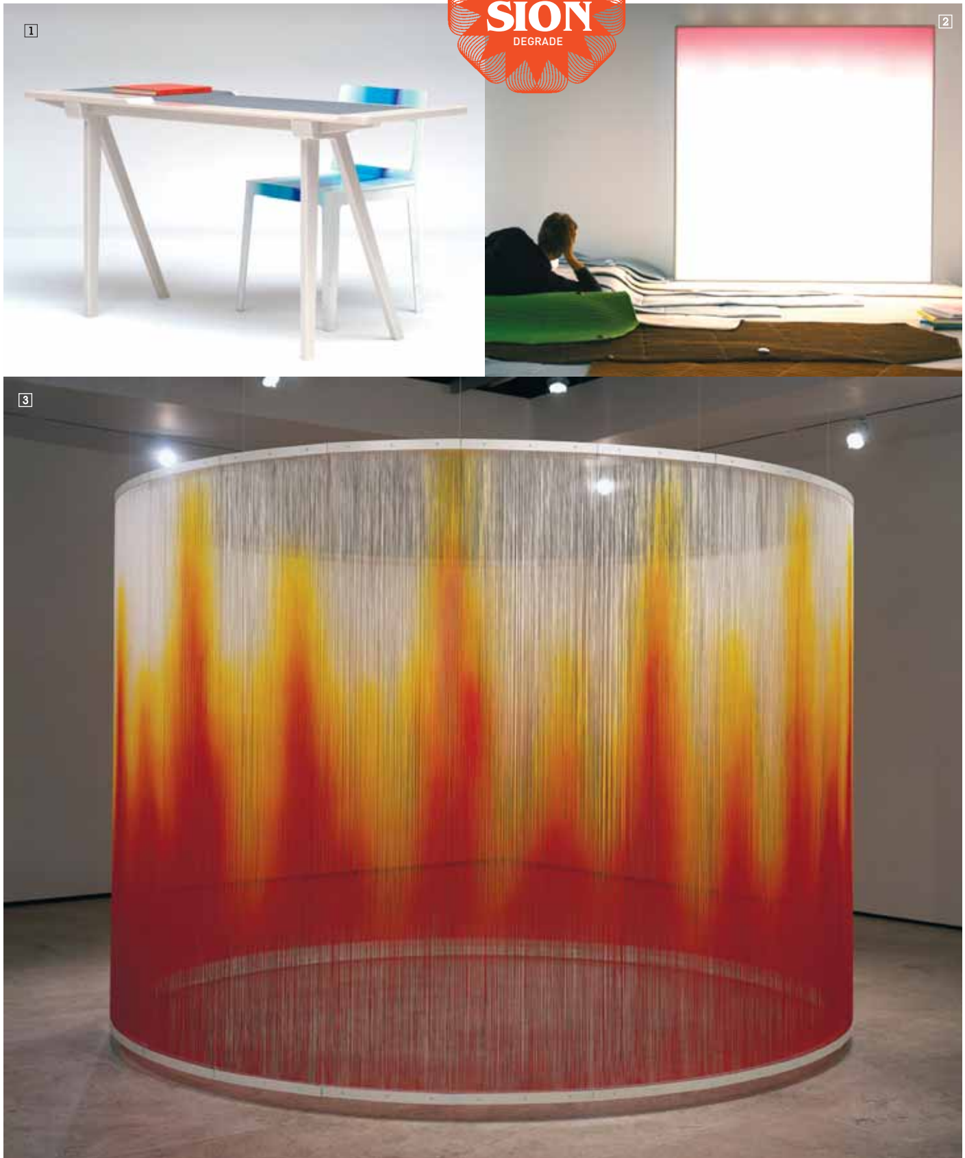
1/ CAPPELLINI Hole chair en aluminio pintado. Diseño de Ronan & Erwan Bouroullec <www.bouroullec.com> <www.cappellini.it>. Mesa Corian DOMEAU ET PÉREZ. Realizada en Corian y cuero. Diseño de Ronan & Erwan Bouroullec <www.bouroullec.com> <www.domeauperes.com> 2/RONAN & ERWAN BOURULLEC The Stitch Room 2007. Instalación en la exposición colectiva "MyHome" en el Vitra Design Museum <www.bouroullec.com> 3/TERESITA FERNÁNDEZ "Fire", (2005) Cortesía de la artista, Lehmann Maupin Gallery, Nueva York y Galería Helga de Alvear, Madrid.