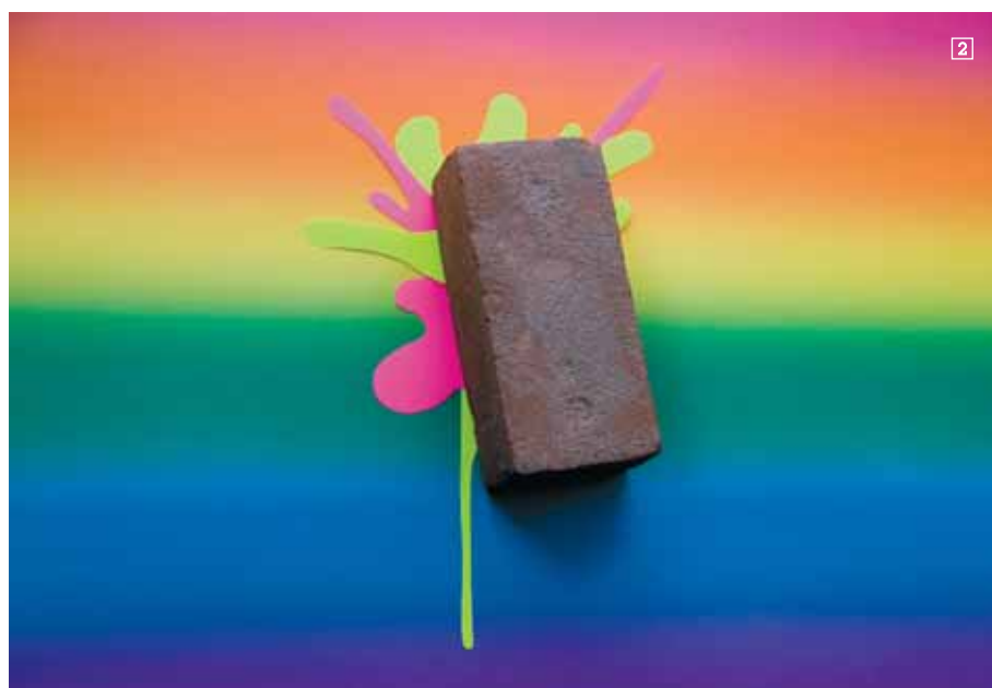
1/5DSL Cinturón chico colección primavera 08. <www.5dsl.com> 2/ANNE DE VRIES. "Smash a rainbow", 2007 3/ARTEMIDE. Lámpara Rigel. Emite luz cromática. Cuando está apagada se convierte en un espejo. Diseño de Carlotta de Bevilacqua. <www.artemide.com>

¿Qué fue antes el huevo o la gallina? Y el vaso, ¿medio lleno o medio vacío? ¿Blanco o negro? ¿Qué no hombre, que también puede ser gris. Qué manía de tomarnos todo a la tremenda. Entre la suma de los colores primarios que es el blanco, y la ausencia de luz, que es el negro, existe una infinidad de colores y matices que el ojo humano es incapaz de apreciar. Lo mismo entre la izquierda y la derecha, sentirse triste o feliz, ser guapo o feo, sentirse ennoblecido o degradado... Hasta aquí queríamos llegar. Es cierto que con el paso del tiempo todos acabamos un poco más "degradados", pero mientras tanto pasamos por la fase del vaso medio lleno y por la del medio vacío, por la del huevo y por la de la gallina. Empezamos con el blanco y acabamos con el negro, nos degradamos y nos ennoblecemos de nuevo. Con esto no creas que pretendemos degradarte, sino demostrarte que, en realidad, el degradé está de moda. Y si no te aclaras pasa a la página siguiente.