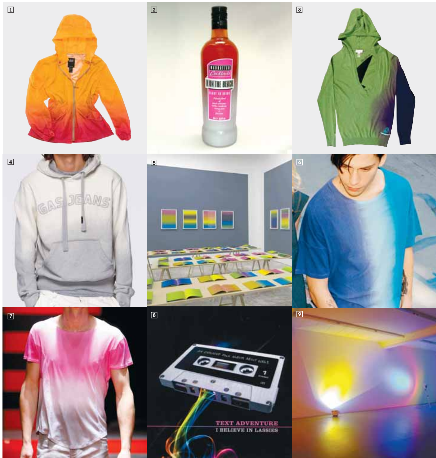
1/SSDSL Chubasquero chica Jertrud. Colección primavera 08. <www.55dsl.com> 2/MANHATTAN COCKTAILS - X ON THE BEACH Saint Brendan's Irish Cream Liqueur Co. Ltd 3/DIESEL Sudadera chico. Colección primavera 08. <www.diesel.com> 4/GAS Sudadera chico. Colección primavera 08. <www.gasjeans.com> 5/OLAF NICOLAI "Considering a multiplicity of appearances in light of a particular aspect of relevance. Or: Can art be concrete?" Courtesy Galerie Erna Hecey, 2007. 6/LEVI'S Camiseta chico. Colección Levi's Engineered Jeans, primavera 08. <www.levis.com> 7/ARMAND BASI Camiseta chico colección primavera 08. Foto: Estrop/Carles Cubos> 8/TEXT ADVENTURE I believe in lassies (Dearstereofan). 9/ANN VERONICA JANSSENS "Reggae Colour, Yellow & Sky Blue, Light Yellow Green". Cortesía de Galerie Micheline Szwajcer.