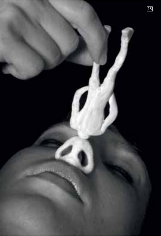
13/ASSUME VIVID ASTRO FOCUS Shada Shada La Chatte, Madrid 2007. 14/CARLES CONGOST Poo. 2005. Fotografía color 100x128. 15/VINCENT KOHLER, Alien. 2006. Serigrafía 1 color. 100x70cm <www.vincentkohler.ch>