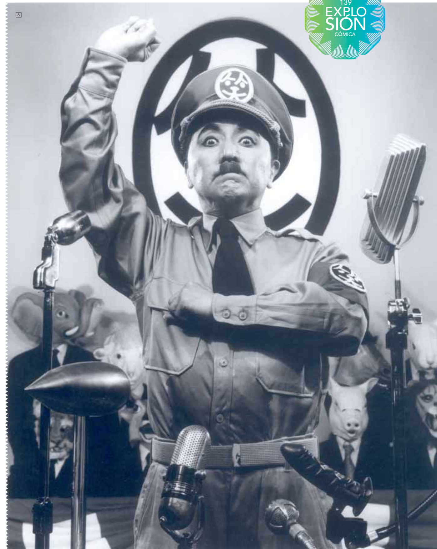
1/WALTER VAN BEIRENDONCK Colección Hombre Otoño Invierno 08/09. Foto: Estrop / Carles Cubos 2/MARTIN MARGIELA Colección Hombre Otoño Invierno 08/09. Foto: Estrop / Carles Cubos 3/WOOYOUNGMI Colección Hombre Otoño Invierno 08/09. Foto: Estrop / Carles Cubos 4/JEAN CHARLES DE CASTELBAJAC Colección Mujer Otoño Invierno 08/09. Foto: Estrop / Carles Cubos 5/VIKTOR & ROLF Colección Mujer Otoño Invierno 08/09. Foto: Estrop / Carles Cubos 6/YASUMASA MORIMURA "A Requiem: Where is the Dictator? 1", 2007. Cortesía Galería Juana de Aizpuru. Esta exposición se podrá visitar del 10 de junio al 20 de julio en la galería Juana de Aizpuru < www.juanadeaizpuru.com >