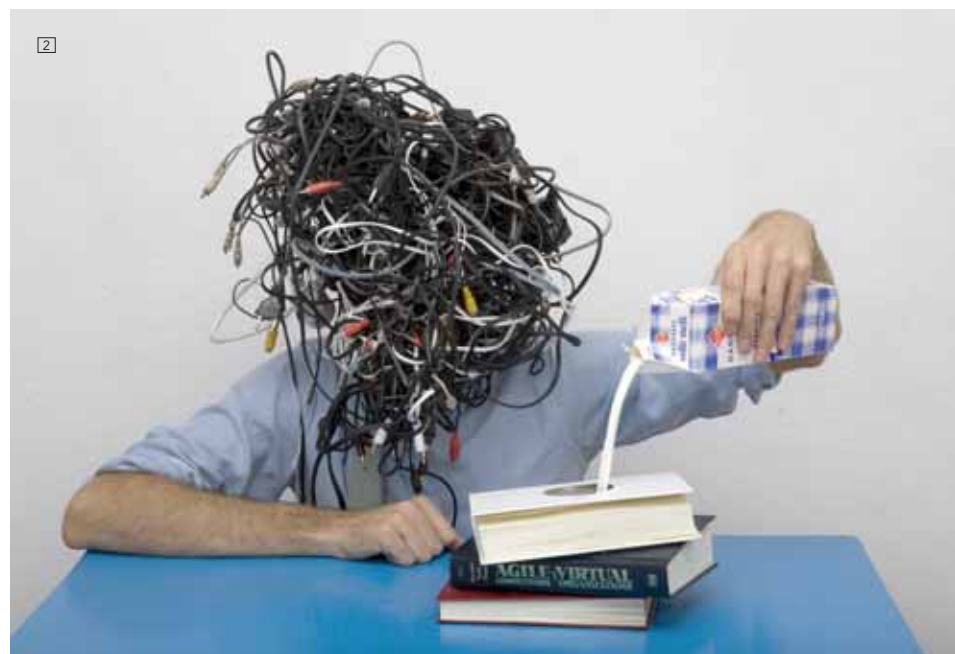
1/HIDDEN ART Lámpara "Wooster" diseño de Jake Phipps, 2008 < www.hiddenartlondon.co.uk > 2/ ANNE DE VRIES "Knowledge for the masses" < www.annedevries.info > 3/ WALTER VAN BEIRENDONCK Colección Hombre Otoño Invierno 08/09.

Hace 4.000 años en China había templos donde las personas se reunían para reír y en la India también tienen "templos de la risa". Vamos, que lo de la risoterapia no es nada nuevo. Y es que está demostrado que la risa disminuye el colesterol, favorece la digestión, ayuda a adelgazar, rejuvenece, disminuye las enfermedades, reduce la angustia y la depresión y hasta actúa como analgésico, ya que al reír liberamos endorfinas, los sedantes naturales de nuestro cerebro. En fin, que todo son ventajas, no tiene contraindicaciones y es gratis. Esperamos que la selección cómica de este mes te provoque, al menos, una sonrisa.