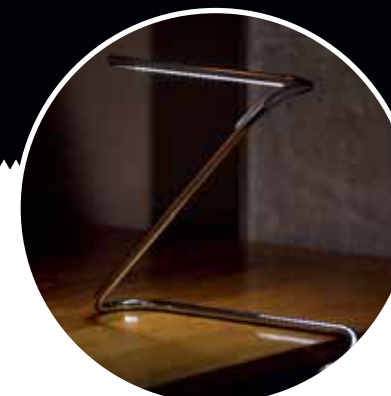
1/GIANT ANGLEPOISE 1227 Con motivo de su 70 aniversario la empresa inglesa Anglepoise ha creado este modelo gigante de su lámpara de mesa Anglepoise 1227 < www.anglepoise.com > 2/GELITIN "Hase (Rabbit)" 2005. Artesina, Piemonte 3/PAPERCLIP LAMP Lámpara de mesa. Diseño de David Wykes y Benoit Collete. < www.papercliplamp.com >