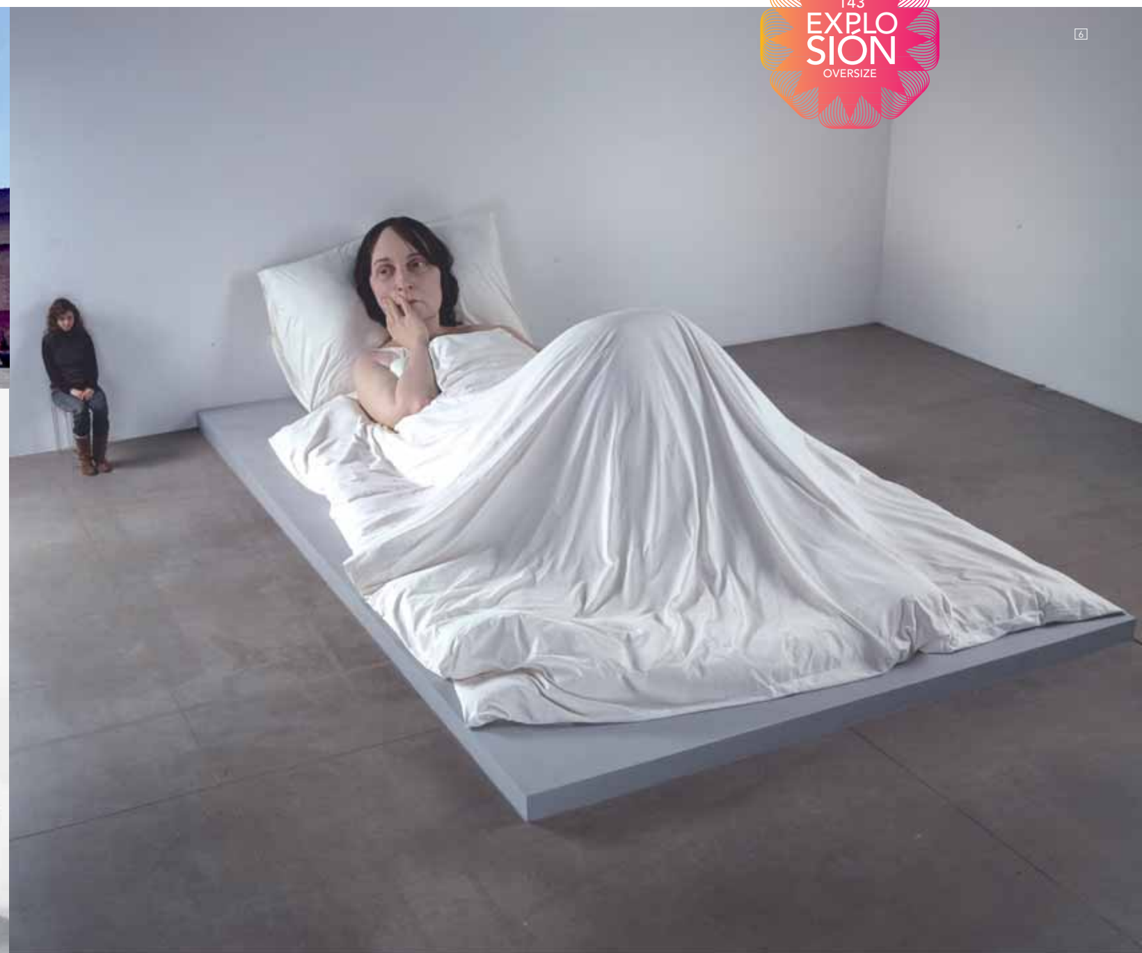
1/JENNIFER ALLORA Y GUILLERMO CALZADILLA "Hope Hippo", 2005. Viena de Venecia 2005 2/ANA PRADA "Objetos apropiados (monuments to fiddling) Anónimo. Tate Modern", 2003. Colección MUSAC 3/EMILIO PUCCI Pulsera Metacrilato. Colección Otoño Invierno 08/09. Foto: Estrop / Carles Cubos 4/MILA SCHON Gafas XXL Colección Otoño Invierno 08/09. Foto: Estrop / Carles Cubos 5/LOUIS VUITTON Zapatos Plataforma Colección Otoño Invierno 08/09. Foto: Estrop / Carles Cubos 6/RON MUECK "In Bed", 2005. Fondation Cartier pour l'art contemporain, Paris Foto: Anthony d'Offay, London.