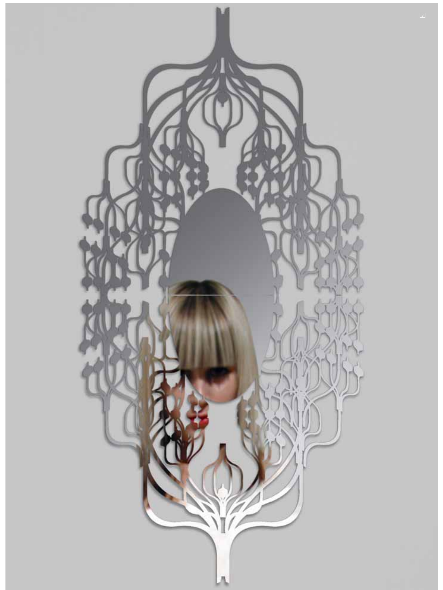
1/WIM DELVOYE "D11 Modelo escala". 2007. Acero Inoxidable cortado con láser. 2/MOROSO asiento My Beautiful Backside, diseño de Doshi-Levie, 2008 < www.moroso.it > 3/DOMESTIC Espejo Spline de la colección Narcise, diseño de Matali Crasset, 2008 < www.domestic.fr >