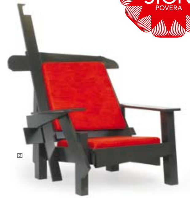
1/ AGGTELEK "Sculptrashformance", 2006 2/ MAARTEN BASS Butaca Treasure. <www.maartenbaas.com> 3/ JESSICA STOCKHOLDER Sin título, 2007