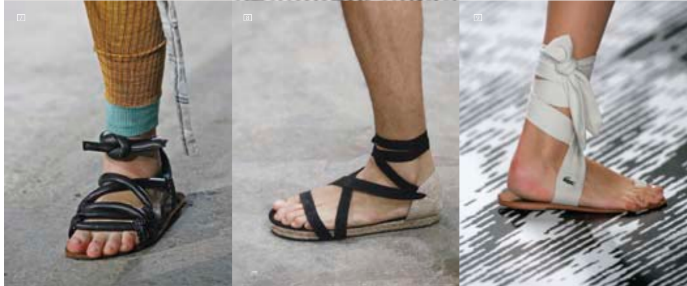
1/ ANN DEMEULEMEESTER Sandalia Colección Hombre Primavera Verano 09 <anndemeulemeester.be> Foto: Estrop / Carles Cubos 2/ CAMPER Together BERNHARD WILLHELM Sandalia Colección Mujer Primavera Verano 09 <camper.es> Foto: Estrop / Carles Cubos 3/ LANVIN Sandalia Colección Hombre Primavera Verano 09 <lanvin.com> Foto: Estrop / Carles Cubos 4/ LEVI'S Red Tab Zapas Colección Primavera Verano 09 <eu.levi.com> 5/ LACOSTE Alpargatas Colección Hombre Primavera Verano 09 <lacoste.es> Foto: Estrop / Carles Cubos 6/ DIESEL Zapas Colección Primavera Verano 09 <diesel.com> 7/ CAMPER Together BERNHARD WILLHELM Calzado Colección Mujer Primavera Verano 09 <camper.es> Foto: Estrop / Carles Cubos 8/ LOUIS VUITTON Alpargatas Colección Hombre Primavera Verano 09 <louisvuitton.com> Foto: Estrop / Carles Cubos 9/ LACOSTE Alpargatas Colección Mujer Primavera Verano 09 <lacoste.es> Foto: Estrop / Carles Cubos