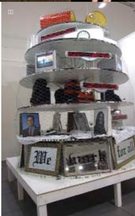
1/ AGATHE SNOW "One (mother earth, staircase)", 2007. Cortesía Peres Projects, © Agathe Snow 2/ JUNYA WATANABE Colección Hombre Otoño Invierno 09/10. Foto: Estrop / Carles Cubos 3/ MASATOMO Colección Hombre Otoño Invierno 09/10. Desfile: Hotel Meurice (París). Foto: Estrop / Carles Cubos 4/ CAPPELLINI Jarrón cerámico PO/0803 diseño de François Azambourg <www.cappellini.it> 5/ MARC BIJL "A Search into the Nature of Society", 2005/6 6/ MAGIS Silla Steelwood. Mezcla metal y madera. Diseño de Ronan & Erwan Bourollec. <www.magisdesign.com>