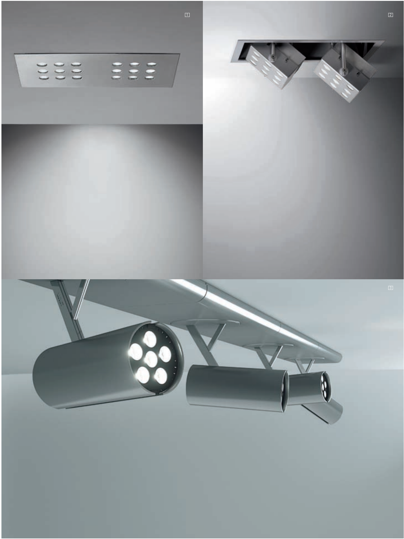
1 y 2/ ARTEMIDE Focos Top Store, diseño de: U.R.S. Nord Light < www.artemide.com > 3/ LUXIT Foco de aluminio Ivy, diseñados por V. Cometti < www.luxit.it > 4/ JEREMY SCOTT Colección Otoño Invierno 09/10. < jeremyscott.com >