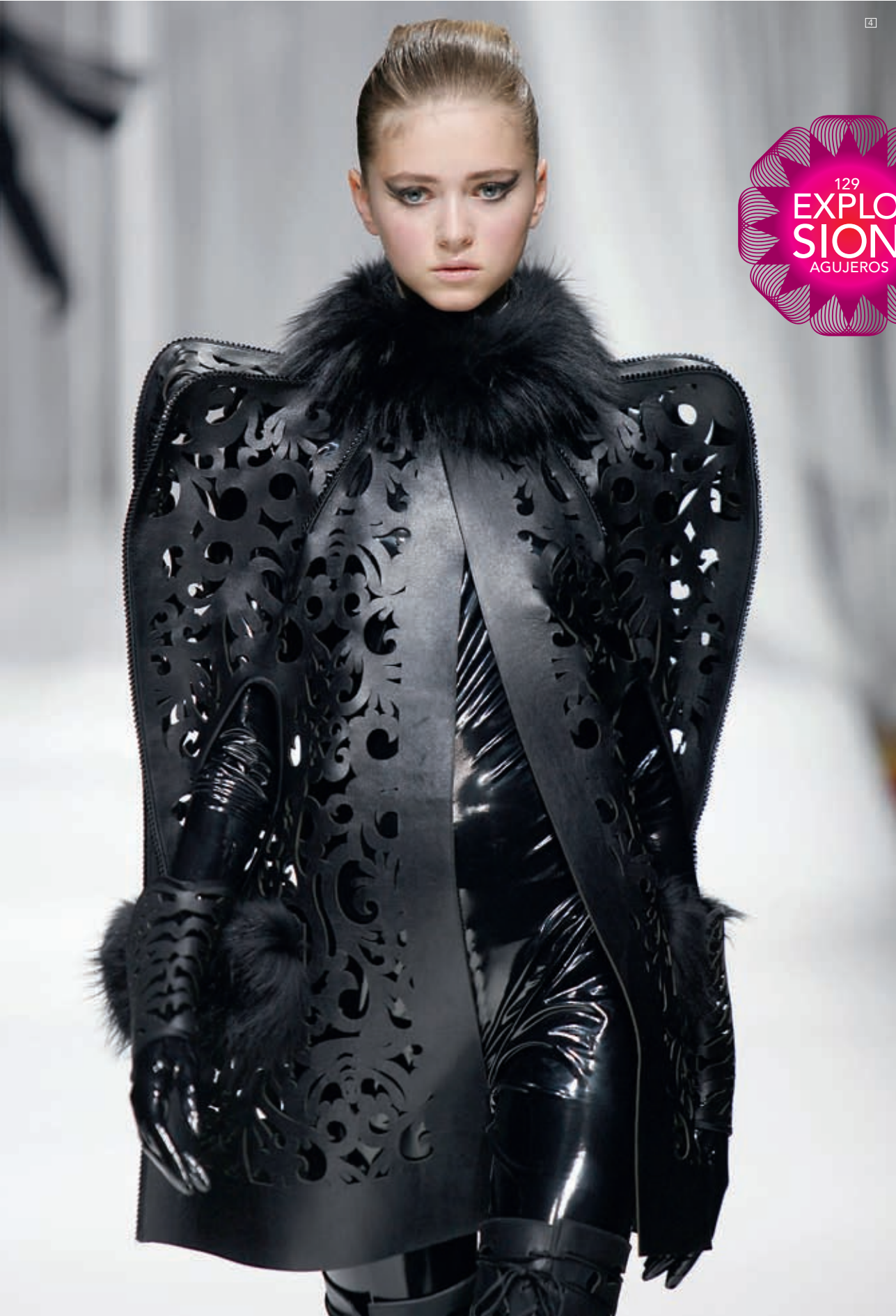
1/ KATRIN BORUP Guantes Stryng. Foto: Ole Akhoj <katrineborup.dk> 2/ DR MARTENS BY JEAN PAUL GAULTIER Botas Colección Mujer Otoño Invierno 09/10. Foto: Estrop / Francesc Tent <jeanpaulgaultier.com> 3/ ANDREAS SLOMINSKI Rat Trap. Cortesía del artista y de Metro Pictures Gallery. 4/ LIE SANG BONG Colección Otoño Invierno 09/10. Foto: Estrop / Francesc Tent <liesangbong.com>