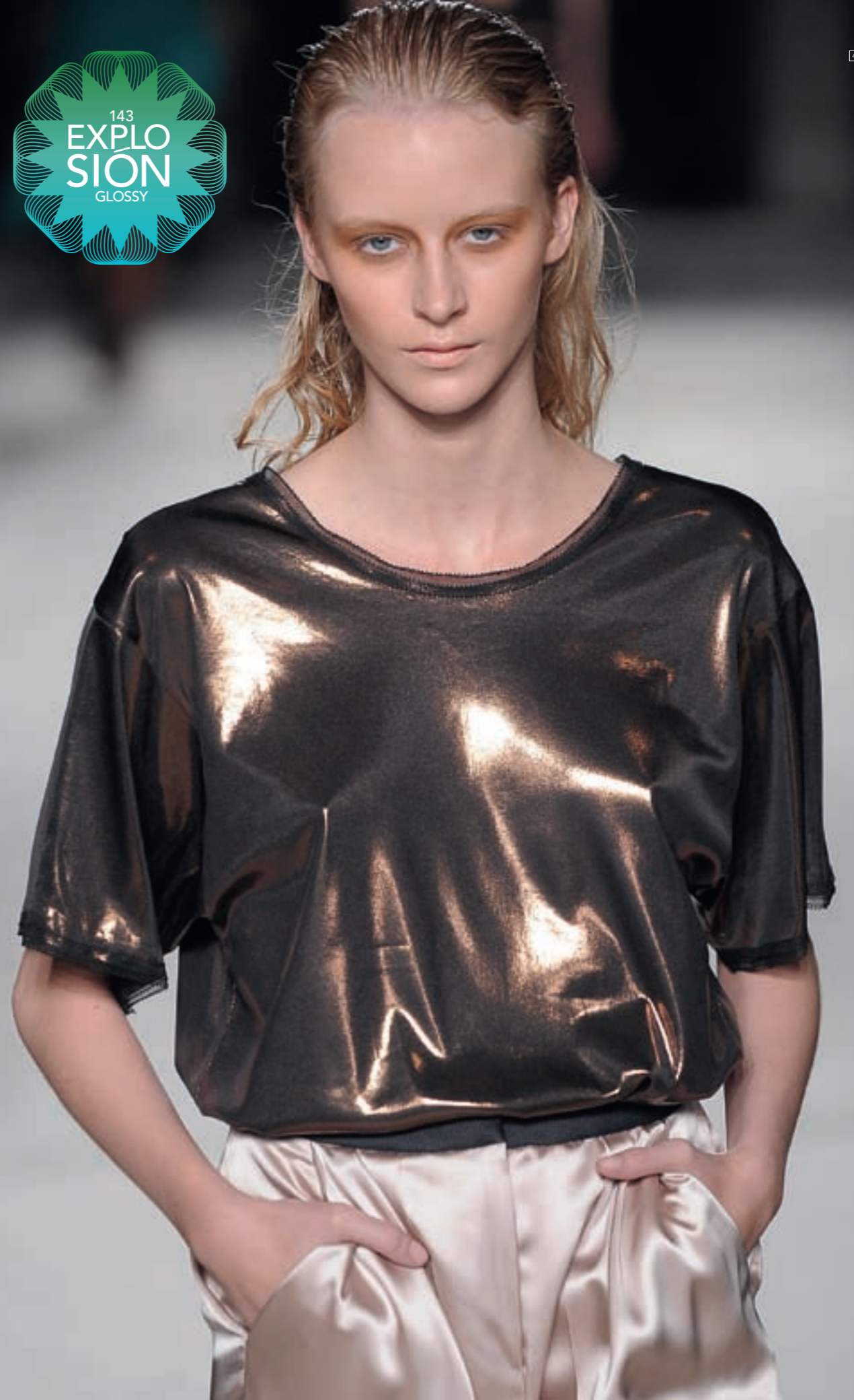
1/ KJERSTI JOHANNESSEN Contemplating 17x21x13 cm (2009) en vidrio soplado. < www.kjerstijohannessen.com > Foto: Kjell Brustad 2/ BANKS VIOLETTE Sin título, 2007. Vista de la instalación en Team Gallery 3/ KENDELL GEERS Eurovisión , 2007. Cortesía de Kendell Geers, Stephen Friedman Gallery y Galleria Continua. 4/ ROKSANDA ILINCIC Colección Mujer Primavera Verano 2010 . Londres Fashion Week. Foto: Estrop / Francesc Tent