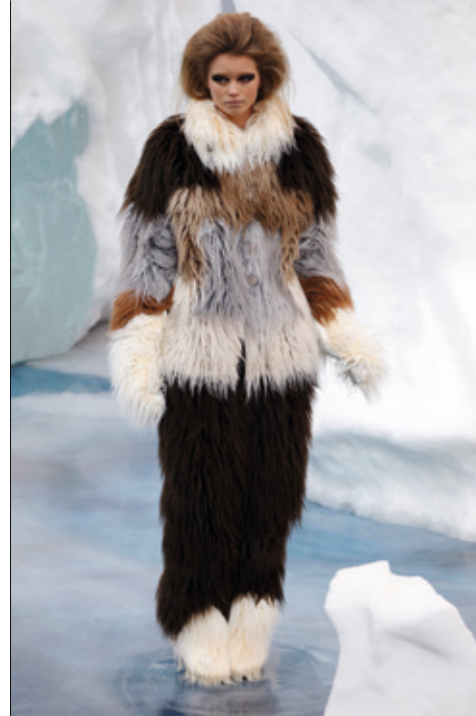
CHANEL Colección Otoño Invierno 2010-11. Modelo: Abbey Lee Kershaw. Foto: Estrop / Francesc Tent <www.chanel.com>