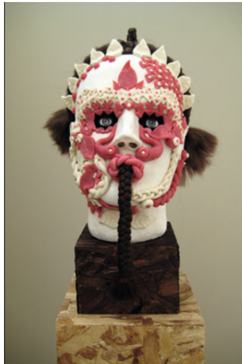
JONATHAN BALDOCK Andromeda. 2007.