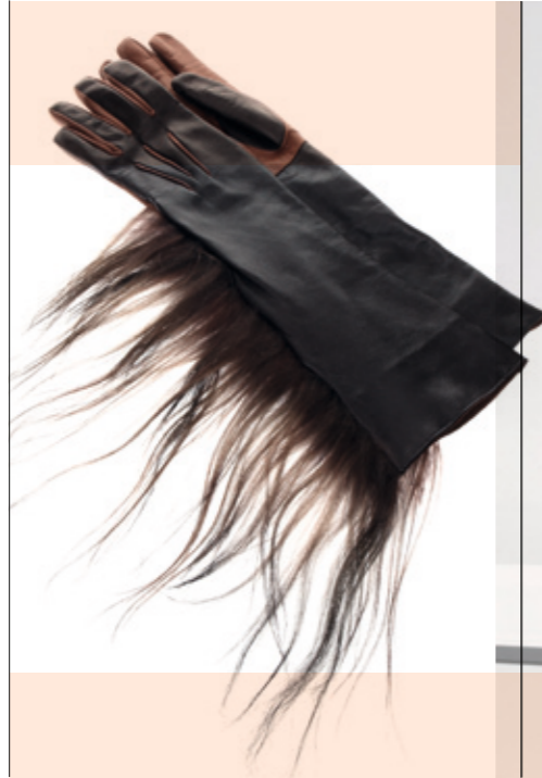
WUNDERKIND Guantes Colección Otoño Invierno 2010-11 <www.wunderkind.de>