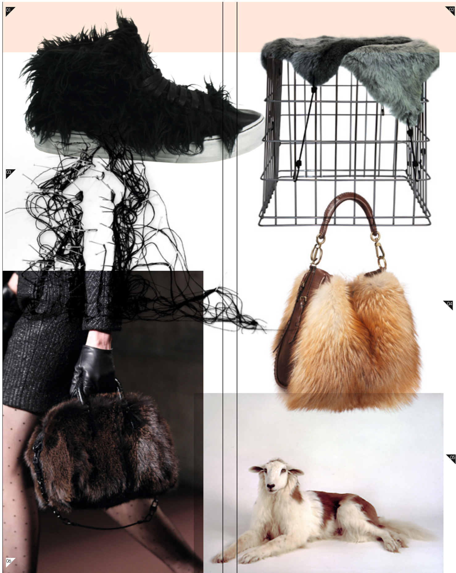
01/ SATORISAN Zapatilla Modelo Teenwolf <www.satorisan.com> 02/ HOPPER Asiento diseñado por Ligt Llov <www.lotilov.de> 03/ ORIGIN Diseño de Debbie Smyth. <www.originuk.org> 04/ DIOR Bolso Libertine Fox. Colección Otoño Invierno 2010-11 <www.dior.com> 05/ THOMAS GRÜNFELD Misfit (St.Bernhard / Sheep). 1994. 06/ LOEWE Bolso Colección Otoño Invierno 2010-11 <www.loewe.com>