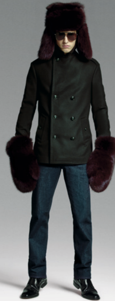
01/ WUNDERKIND Botas Hombre Colección Otoño Invierno 2010-11 <www.wunderkind.de> 02/ PAOLA PIVI What is my name. 2007. 03/ COLECCIÓN PRETY PRETY Pouf, diseño de Dejana Kabiljo <www.kabiljo.com> 04/ LOEWE Total Look Colección Otoño Invierno 2010-11 <www.loewe.com> 05/ LOUIS VUITTON Bolso Colección Otoño Invierno 2010-11 <www.louisvuitton.com>