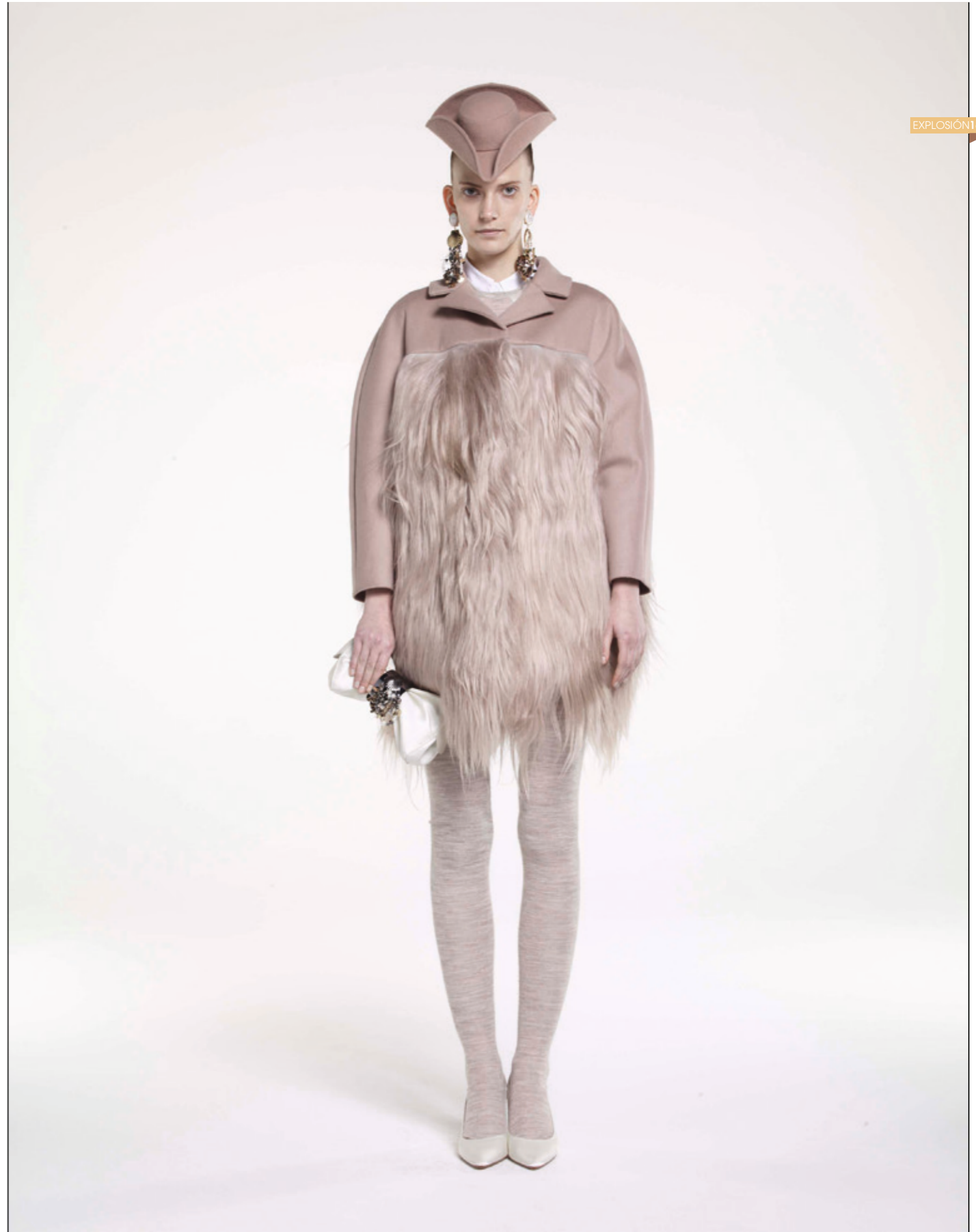
PAUL KA Colección Otoño Invierno 2010-11 <www.pauleka.com>

HACE ALGUNAS DÉCADAS EL PELO, O MÁS BIEN, EL PEINADO, ERA UNA DE LAS SEÑAS DE IDENTIDAD QUE DISTINGUÍA UNAS TRIBUS URBANAS DE OTRAS. PARA SABER LOS GUSTOS MUSICALES DE ALGUIEN SOLO HABÍA QUE MIRARLE LA CABEZA Y LOS PIES. EN LA ANTIGÜEDAD EL PELO REPRESENTABA LA FUERZA, Y TAMBIÉN SE LE ATRIBUYERON PODERES MÁGICOS, DE HECHO, A LAS BRUJAS DE LA EDAD MEDIA SE LES AFEITABA CABEZA Y CUERPO, PORQUE CREÍAN QUE EN EL PELO TENÍAN PARTE DE SU PODER. DEL PEINADO, COMO DISTINTIVO SOCIAL, SE VALIERON SIEMPRE LOS PERSONAJES IMPORTANTES: DESDE LAS PELUCAS DE LA REALEZA EGIPCIA A LOS PEINADOS IMPOSIBLES DE LA NOBLEZA DEL RENACIMIENTO. YA EN EL SIGLO 20 EL PELO SE CONVIRTIÓ EN INSIGNIA DE MUCHOS MOVIMIENTOS SOCIALES Y CULTURALES. LA LLEGADA A LA MODA DEL PELO SINTÉTICO SUPUSO UN ALIVIO PARA LOS DEFENSORES DE LOS ANIMALES, Y UN INCREMENTO EN LA MANUFACTURA DE TODO TIPO DE PRENDAS Y OBJETOS. COMO ESTE ES NUESTRO NÚMERO 100 Y A ESA EDAD ESTAREMOS TODOS CALVOS, DISFRUTEMOS AHORA DEL PELO PROPIO Y AJENO CON ESTA BONITA Y PELUDA EXPLOSIÓN.