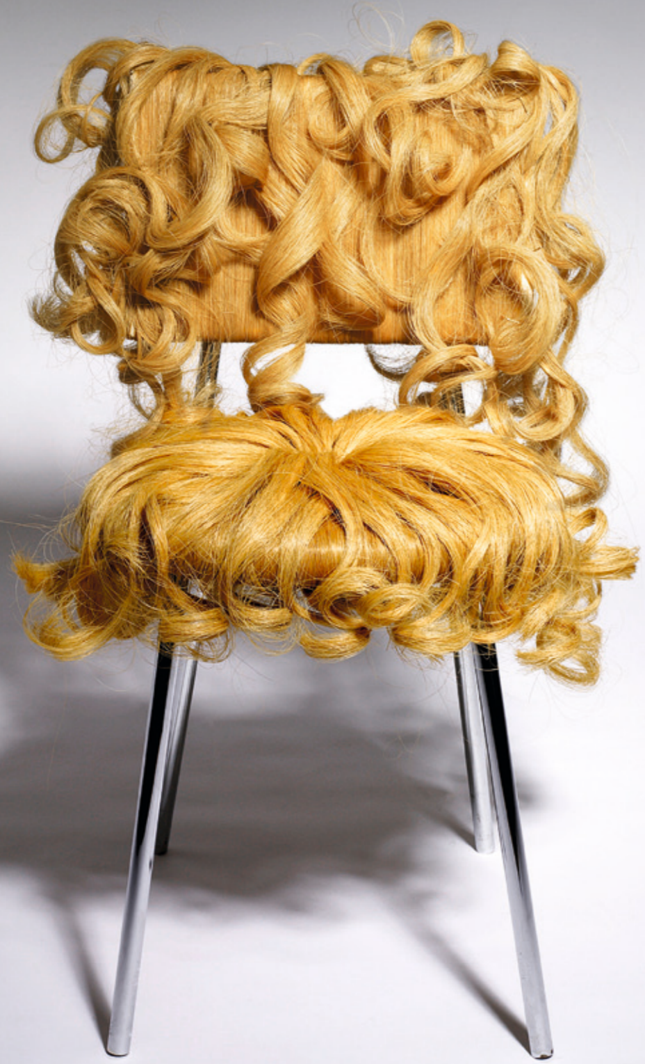
COLECCIÓN PRETY PRETY Silla diseñada por Dejana Kabiljo <www.kabiljo.com>