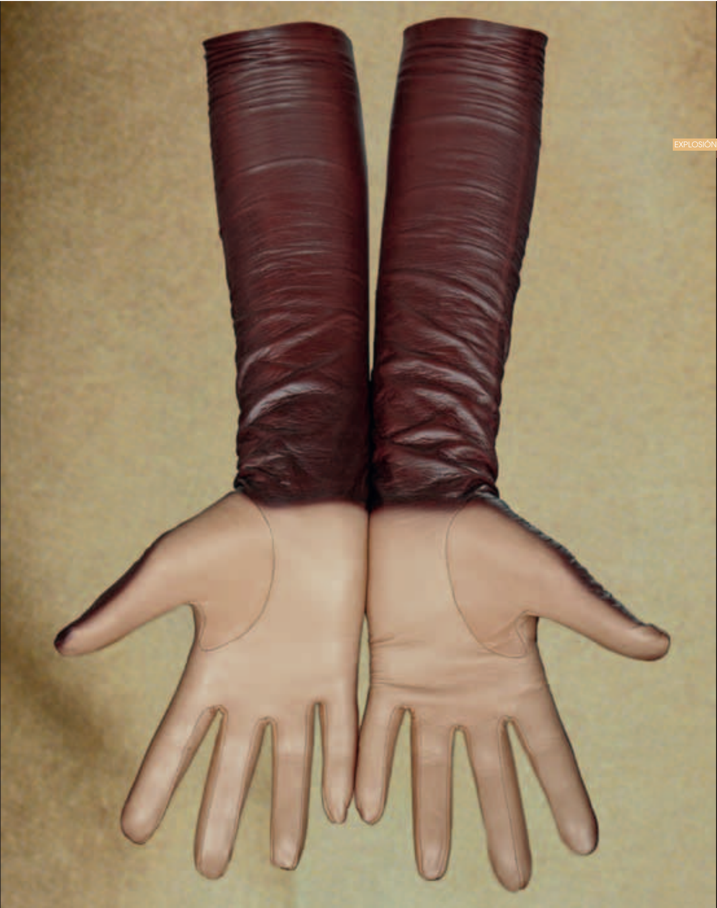
SKINOVER by SILVIA B Guantes The Ebony Model <skinover.biz>