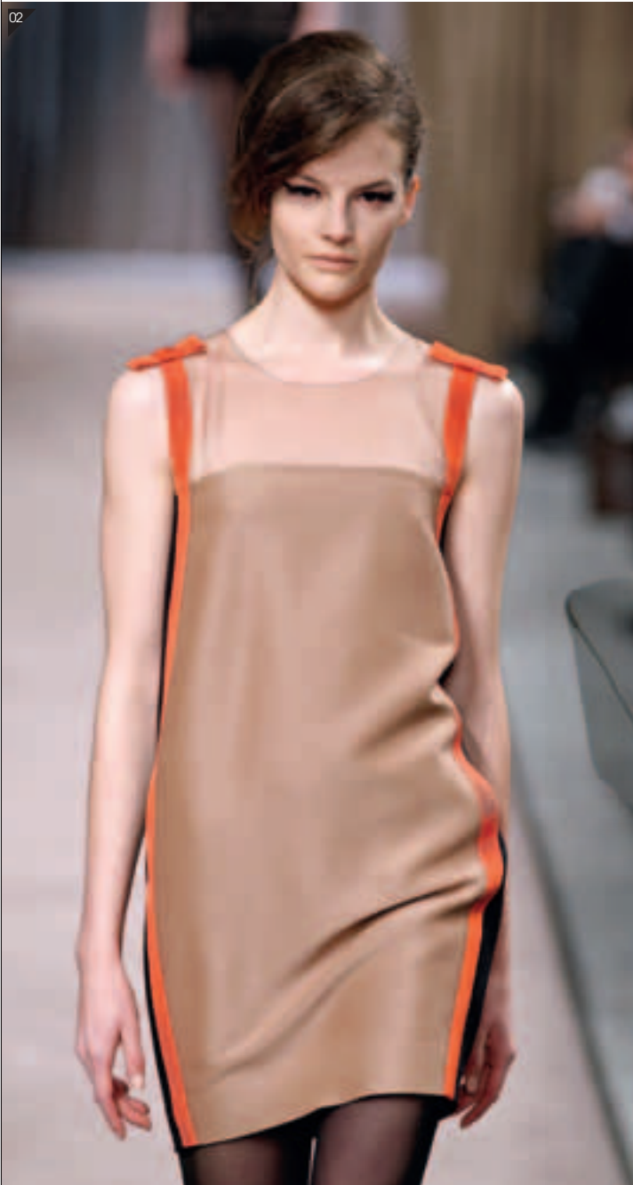
01/ DIOR Monedero Pink Galuchat Minaudiere. Colección Primavera Verano 2010 (915 224 696) 02/ GIAMBATTISTA VALLI Colección Otoño Invierno 2010 <giambattistavalli.com>