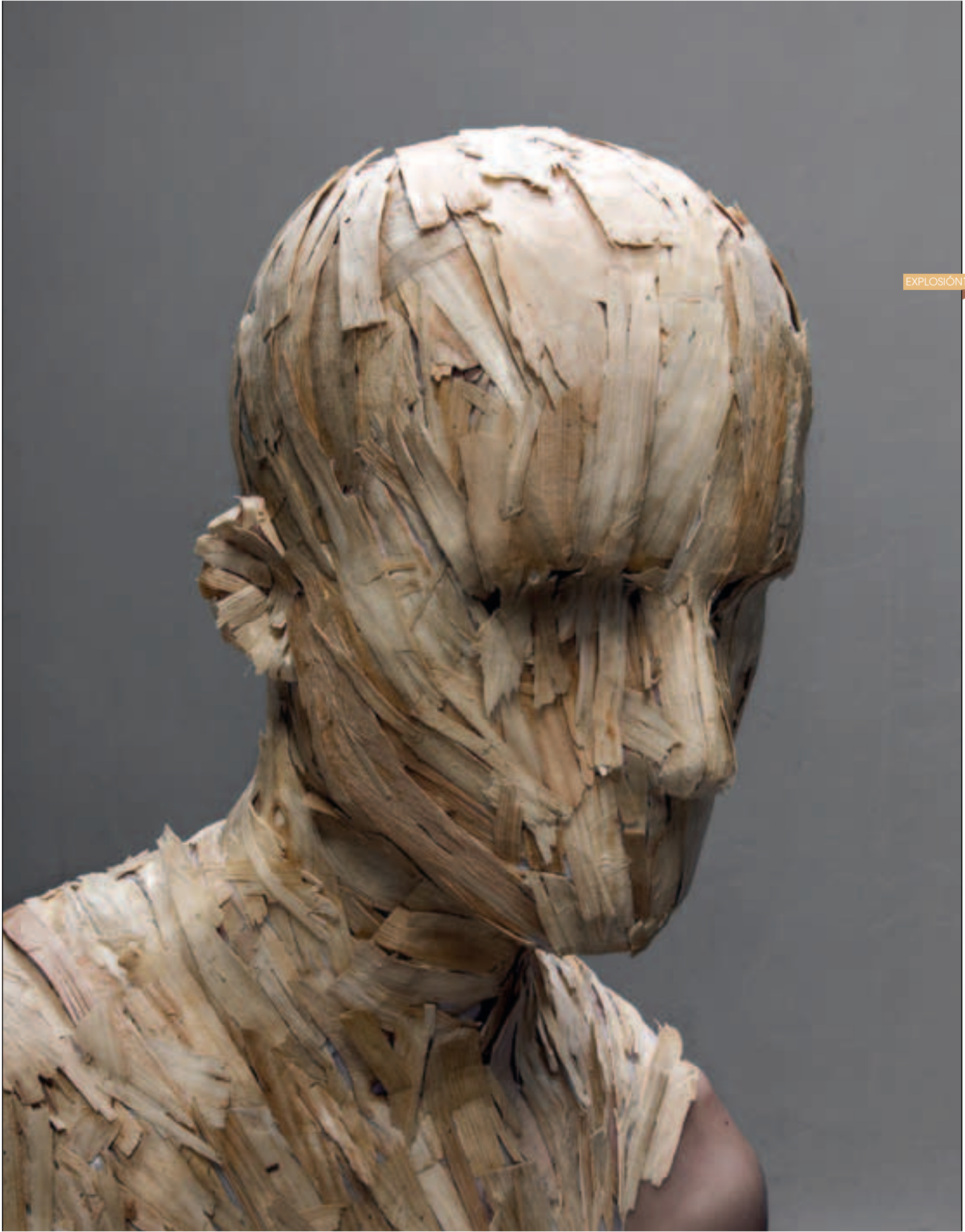
LEVI VAN VELUW Sterling Wood, de la serie Material Transfers. 2008 < www.levivanveluw.nl>

SOBRE LA PIEL HUMANA HAY MUCHAS CURIOSIDADES QUE NO TODO EL MUNDO SABE, COMO POR EJEMPLO QUE NUESTRO CUERPO PRODUCE UNOS 18 KILOS DE PIEL INERTE A LO LARGO DE SU VIDA, MUCHA DE ELLA SE ENCUENTRA ENTRE EL POLVO DE LA CASA; O QUE EN UN DÍA CALUROSO NUESTRA PIEL PUEDE LLEGAR A LIBERAR 11 LITROS Y MEDIO DE SUDOR... LA PIEL PROTEGE NUESTROS MÚSCULOS, HUESOS, NERVIOS... ES NUESTRO ENVOLTORIO CORPORAL. AUNQUE SUPERFICIAL Y ESTILIZADA (SU GROSOR ES DE 2 MILÍMETROS) LA PIEL TAMBIÉN TIENE SU MUNDO INTERIOR Y CONSTA DE TRES CAPAS: SUBCUTÁNEA, DERMIS Y EPIDERMIS, LA CAPA EXTERNA QUE INTERVIENE EN LA FUNCIÓN DEL TACTO. AHÍ ES DONDE TENEMOS LAS TERMINACIONES NERVIOSAS, LLAMADAS RECEPTORES DEL TACTO, QUE TRANSPORTAN LAS SENSACIONES HACIA EL CEREBRO A TRAVÉS DE LAS FIBRAS NERVIOSAS. NUESTRA PIEL ES LO QUE LOS DEMÁS VEN DE NOSOTROS, ASÍ QUE NOS ESFORZAMOS PORQUE LUZCA BELLA Y JOVEN, Y LE DEDICAMOS NUESTROS MAYORES MIMOS Y CUIDADOS. LA PIEL ANIMAL TAMBIÉN NOS FASCINA, PROTEGE, ADORNA Y ABRIGA DESDE EL PRINCIPIO DE LOS TIEMPOS, ASÍ QUE, NO ES DE EXTRAÑAR QUE INNUMERABLES ARTISTAS Y DISEÑADORES HAYAN UTILIZADO PIEL, YA SEA HUMANA O ANIMAL, EN SUS CREACIONES. AHORA NOS TOCA A NOSOTROS HACERLE UN PEQUEÑO HOMENAJE. ESPERAMOS QUE ESTA EXPLOSIÓN OS PONGA LA PIEL DE GALLINA.