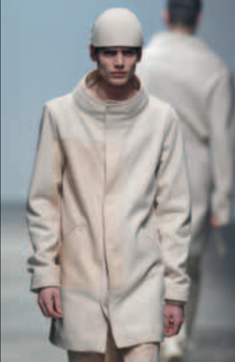
ROMAIN KREMER Colección Otoño Invierno 2010 <romainkremer.free.fr>