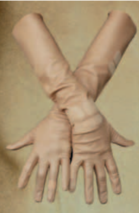
SKINOVER by SILVIA B Guantes The Wounded Model <skinover.biz>