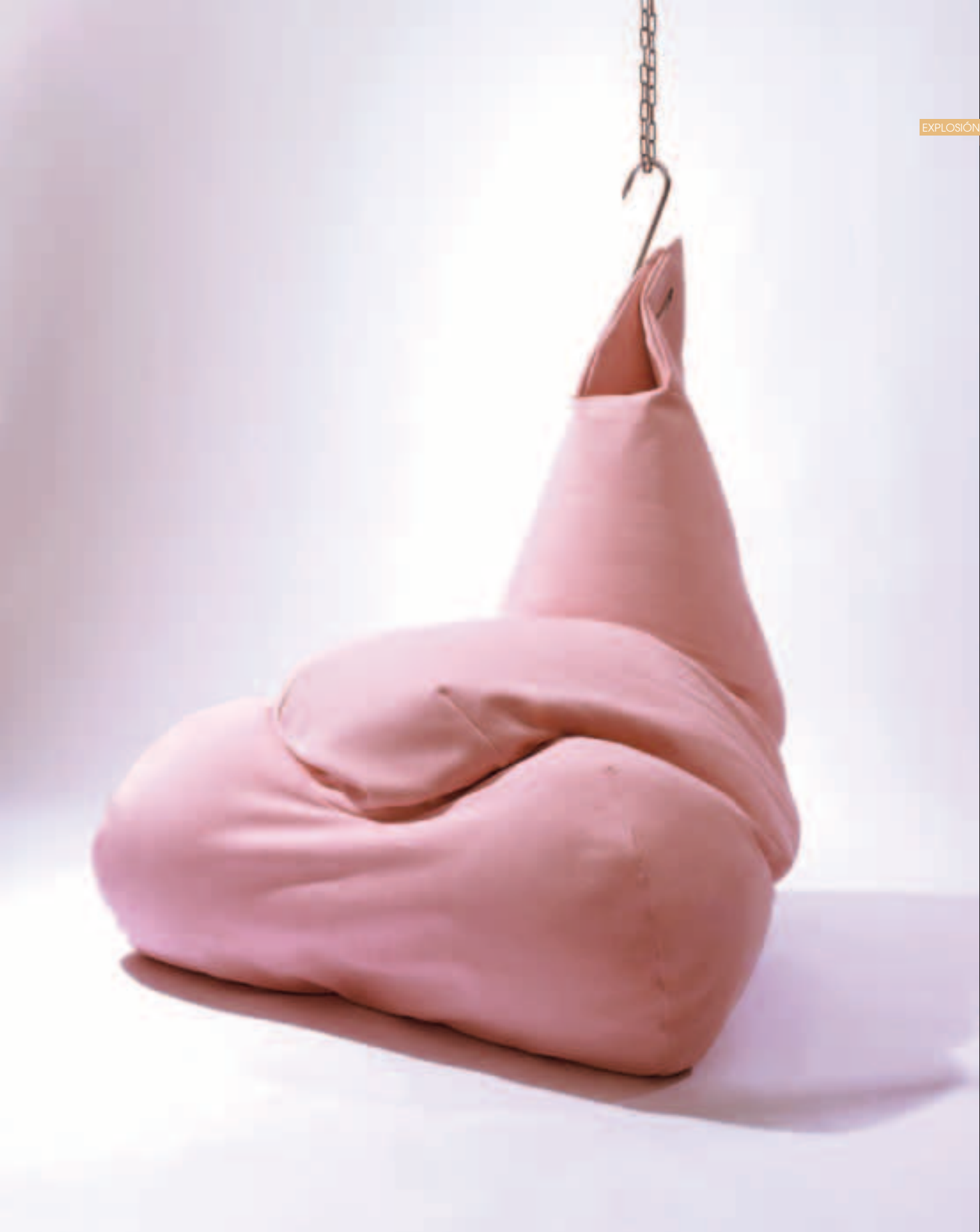
FAT Asiento diseñado por Dejana Kabiljo, 2010. <www.kabiljo.com>