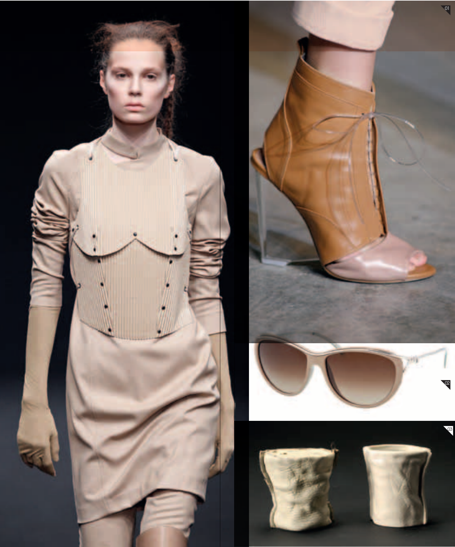
AF VANDEVORST Colección Otoño Invierno 2010 <afvandeorst.be>