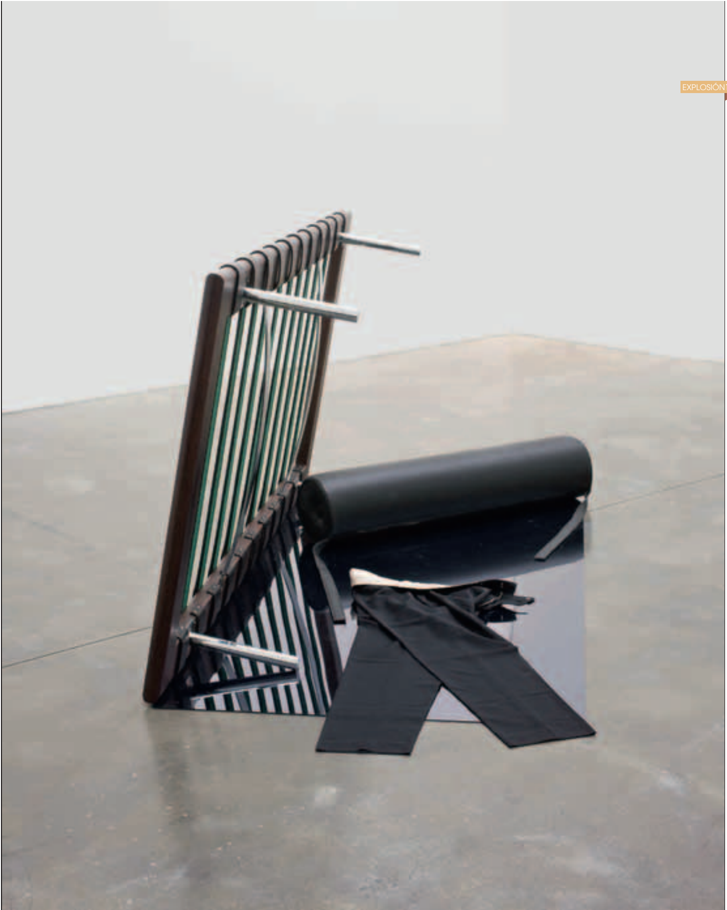
TOM BURR , Black Slacks, 2008. Bortolami. New York.