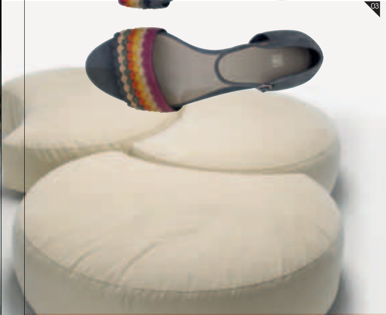
03/ CAMPER Sandalias Mujer Línea Twins. Colección Primavera Verano 2010 (915 237 096) 04/ LIVING DIVANI Sistema modular de asientos Pasticca. Diseño de Piero Lissoni. <livingdivani.it>