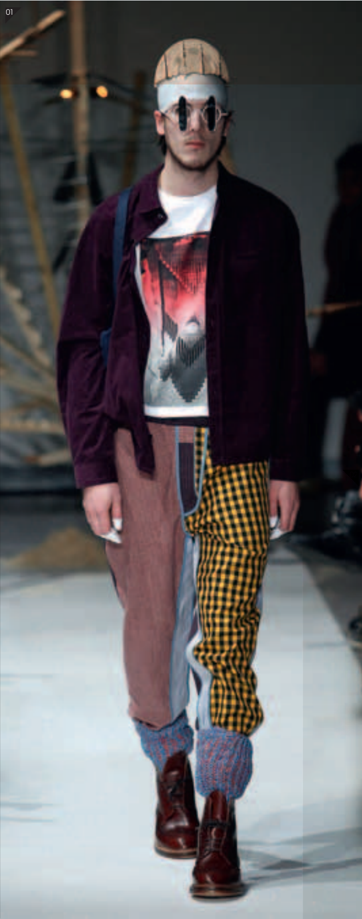
01/ HENRIK VIBSKOV Colección Hombre Otoño Invierno 2010-11 <henrikvibskov.com> 02/ HORROR VACUI,

una instalación de Michael Pinsky. Foto: Pinsky.