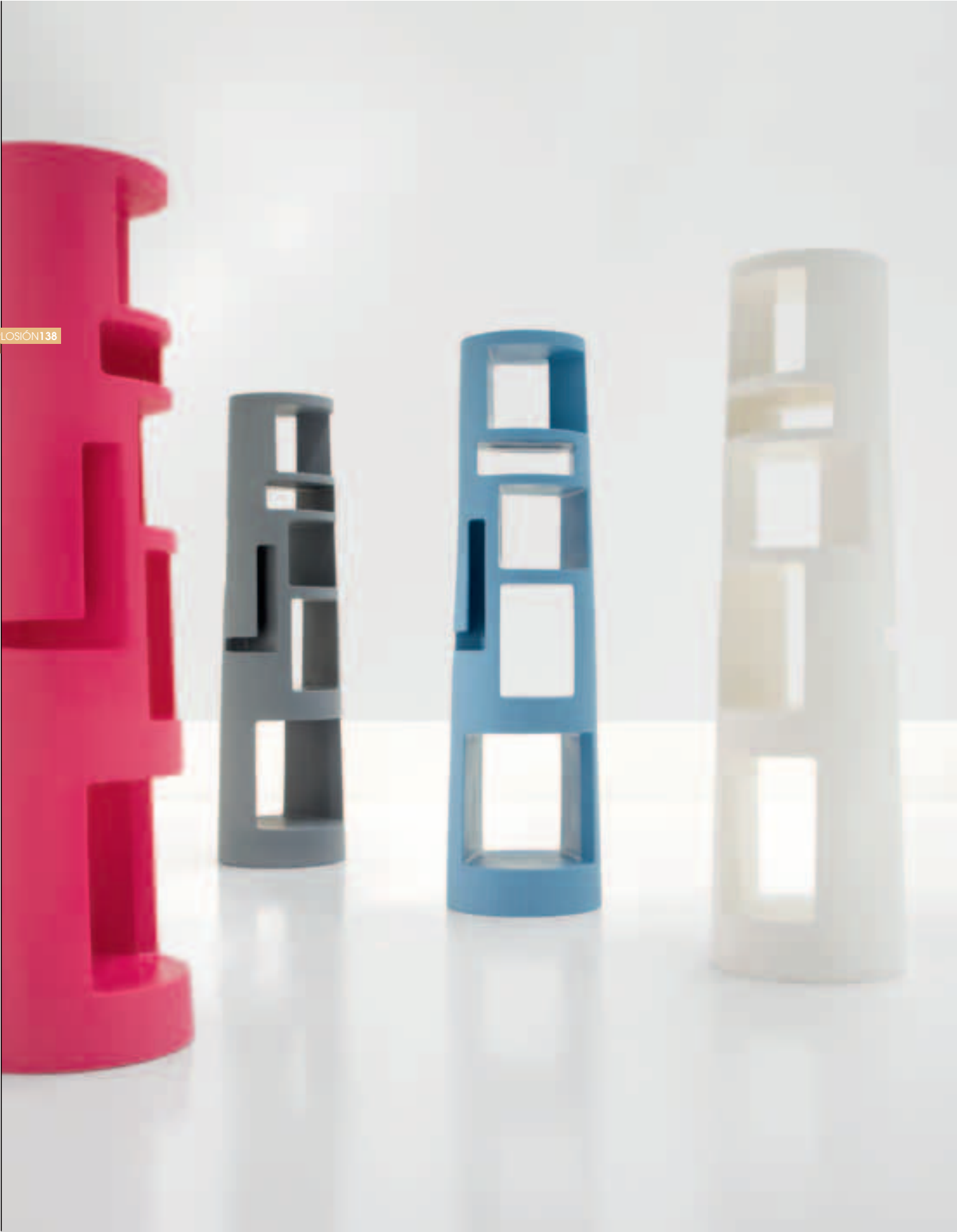
BONALDO Estantería Babel. Diseño Mario Mazzer. <bonaldo.it>