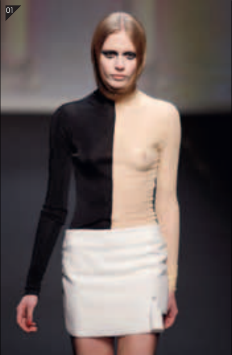
01/ INGRID VLASOV Colección Otoño Invierno 2010 <ingridvlasov.com>